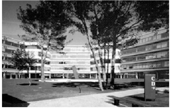
Fig. 5. Parc empresarial a Sant Cugat.