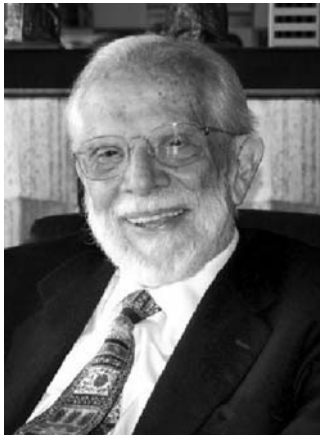
Fig. 1. Josep M. Fargas.

En el marc de la recuperació de l'arquitectura moderna, després dels canons estilístics imposats després de la Guerra Civil, l'obra del despatx Tous i Fargas representa una de les línies més innovadores per l'ús dels nous materials, l'aplicació d'un rigor industrial i d'una estricta coordinació dimensional, i la introducció d'elements de gran dimensió fabricats fora de l'obra. A partir de 1991 va treballar sol. És l'arquitectura que de forma més directa prové de l'enfocament del disseny industrial, segurament de quan havien projectat les motos de la casa Lube-NSU o els amplificadors de música de la casa Vieta, o les botigues de Georg Jensen i Audio. La planta del deganat de la seu del col·legi d'arquitectes en fou l'obra més representativa d'aquells inicis.