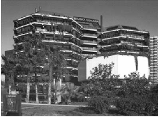
Fig. 4. Seu pel Banc Industrial de Catalunya.