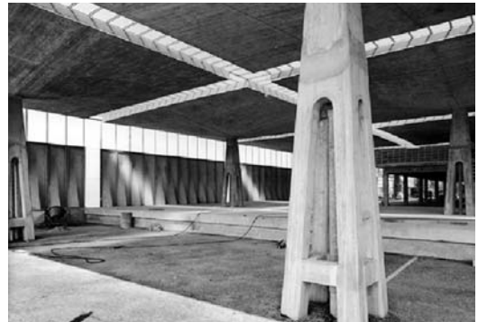
Fig. 3. Projecte per KAS a Vitòria.