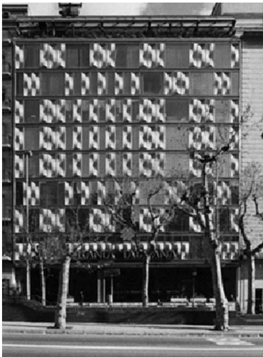
Fig. 6. Edifici de la Banca Catalana.