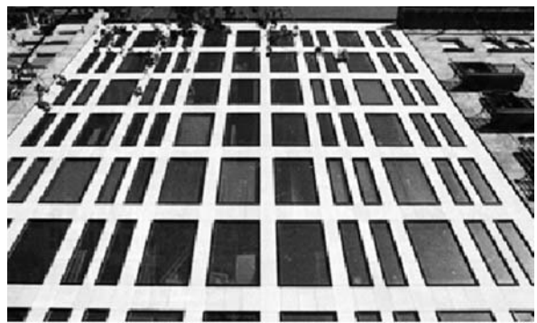
Fig. 7. Edifici a l'inici del Passeig de Gràcia.