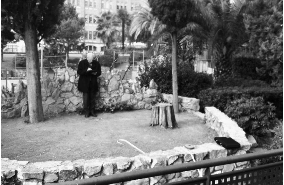
Fig. 7. Placeta alta damunt de la cova-capella.