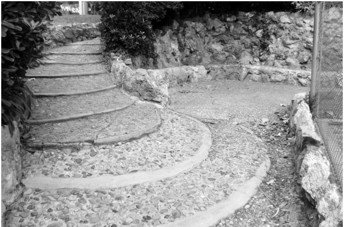
Fig. 8. L'escala d'en Gaudí.