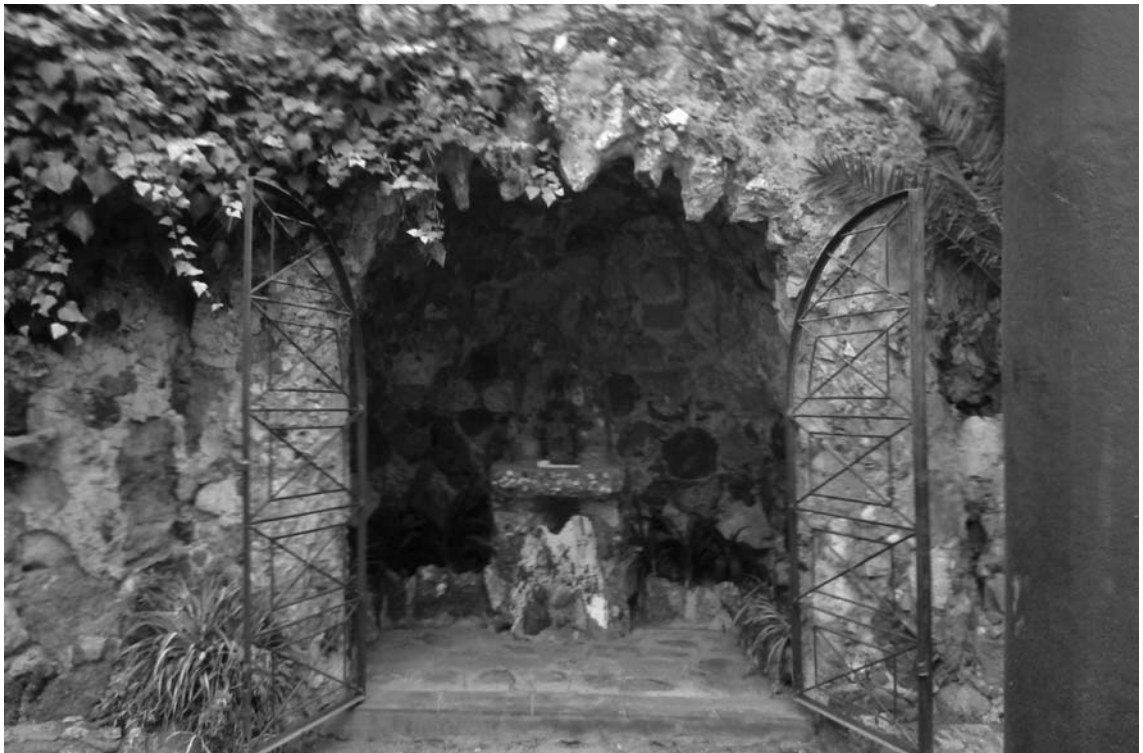
Fig. 6. Visió frontal de la cova-capella.