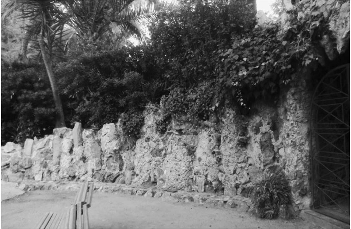
Fig. 5. Muret lateral de tancament de la placeta dreta.