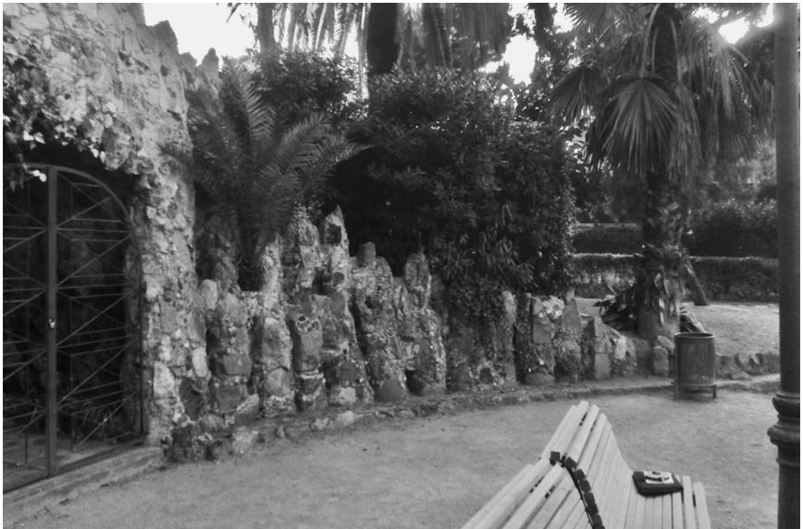
Fig. 4. Muret lateral de tancament de la placeta esquerra.