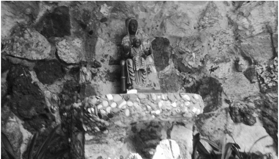
Fig. 2. Interior amb imatge.