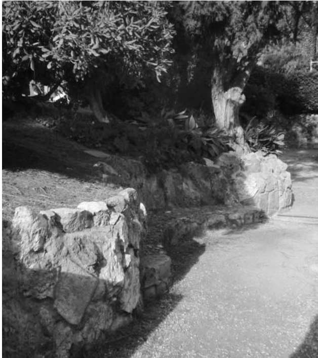
Fig. 9. Murets i bancs al voltant de l'espai esportiu.