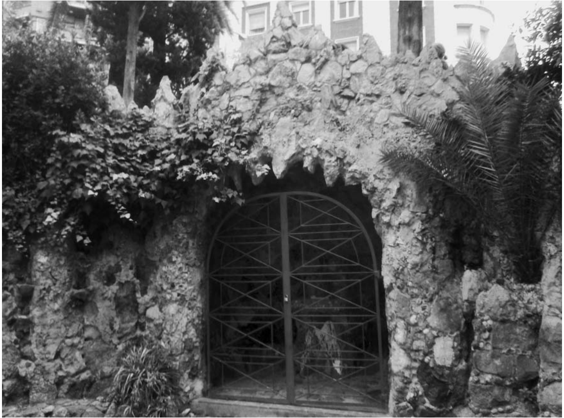
Fig. 1. Visió frontal de la cova-capella. Reixa de tancament posterior.