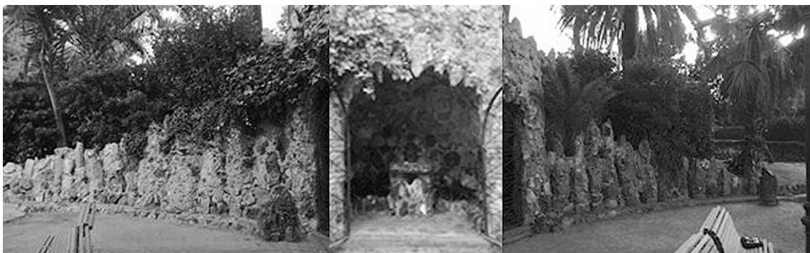
Fig. 12. Composició perimetral de la plaça.