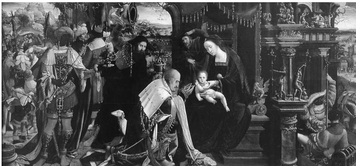
Fig. 1. Mestre de l'Epifania d'Anvers o monogramista G, Epifania , s.d., RACBASJ, inv. 909 (MNAC 5.718).

La segona de les claus que condicionen el MNAC des de la seva prehistòria és la forma com es va resoldre la situació anòmala en que el franquisme havia situat el seu antecedent major, el Museu d'Art de Catalunya, atribuint-lo a l'Ajuntament de Barcelona. La dura pugna política sostinguda entre la Generalitat, governada per Convergència i Unió, i l'Ajuntament de Barcelona, governat pel PSC, fins pocs anys abans dels Jocs Olímpics de Barcelona de 1992, va comportar que la titularitat