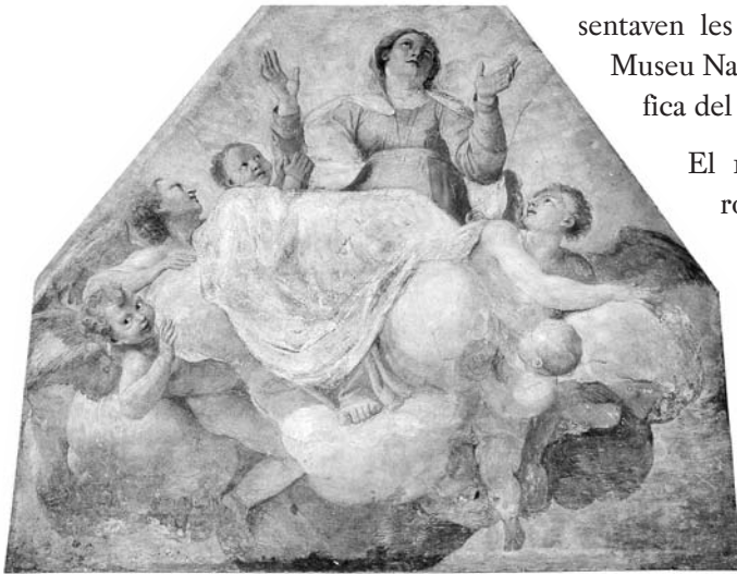
Fig. 2. Annibale Carracci, Assumpció de la Verge , 1604-1605. RACBASJ, inv. 890 (MNAC 5.674).