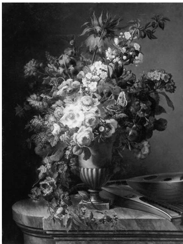
Fig. 5. Francesc Lacoma Fontanet, Gerro amb flors , 1805, RACBASJ, inv. 902 (MNAC 10.440).

De tota manera serà bo no perdre de vista que el principal actiu del museu és constituït per les seves pròpies col·leccions i que consegüentment totes les actuacions haurien de convergir en la seva posada en valor, documentant-les, investigant al seu entorn, difonent-ne el coneixement, garantint-ne la con-