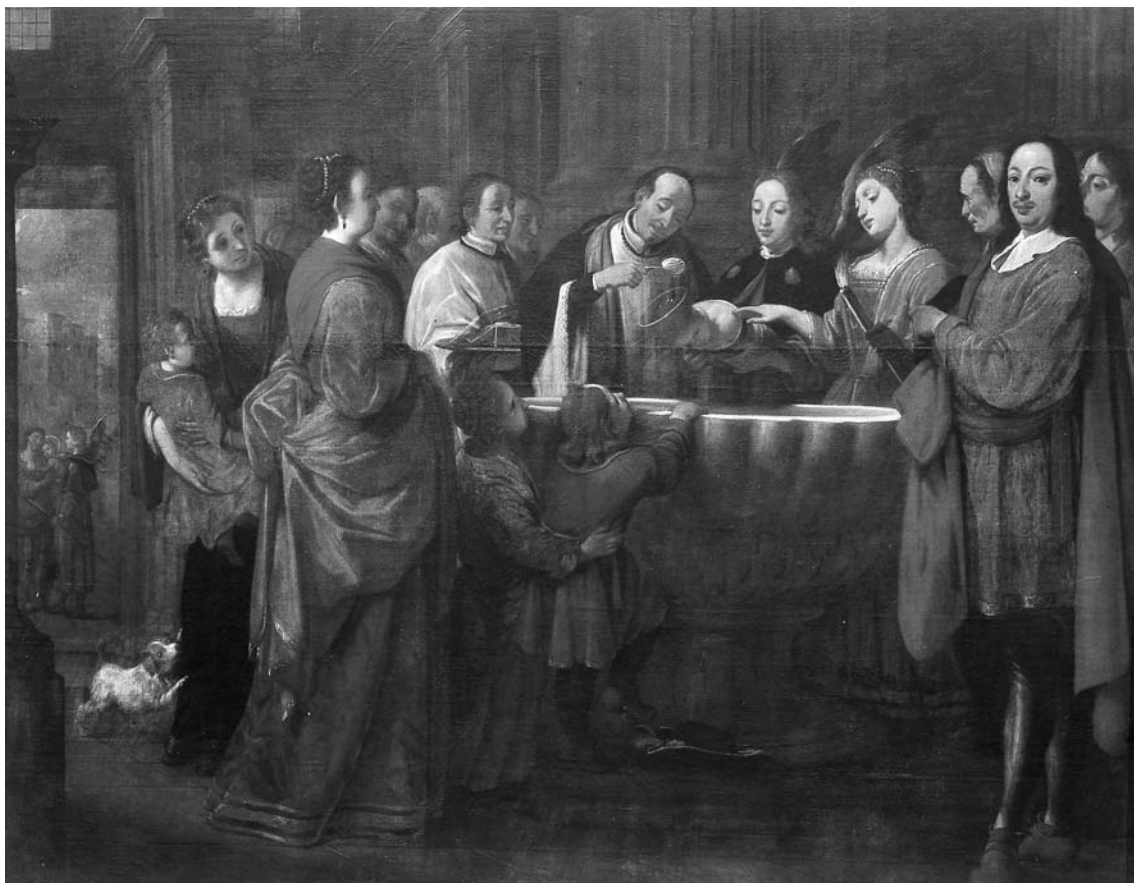
Fig. 3. Antoni Viladomat, Bateig de Sant Francesc , 1722-1424. RACBASJ, inv. 914 (MNAC II.540).

hi aspectes opinables o decididament criticables. Les col·leccions no presenten grans sorpreses (llevat de la novetat causada pel retrobament d'obres no exposades durant molt de temps) però la seva integració en un mateix complex museístic pot generar sinergies interessants. Els seus punts més forts són, com és prou ben sabut, les col·leccions d'art romànic, la importància de les quals és reconeguda a nivell mundial, l'art gòtic i el modernisme, encara que la presència d'aquest últim resta una mica diluïda en el context de l'art dels segles XIX i XX. Totes les seccions contenen obres de primera importància i la més desequilibrada és probablement la d'art del segle XX per l'absència d'obres veritablement antològiques dels grans mestres de l'avantguarda catalans o directament relacionats amb Catalunya: Picasso, Dalí i Miró.