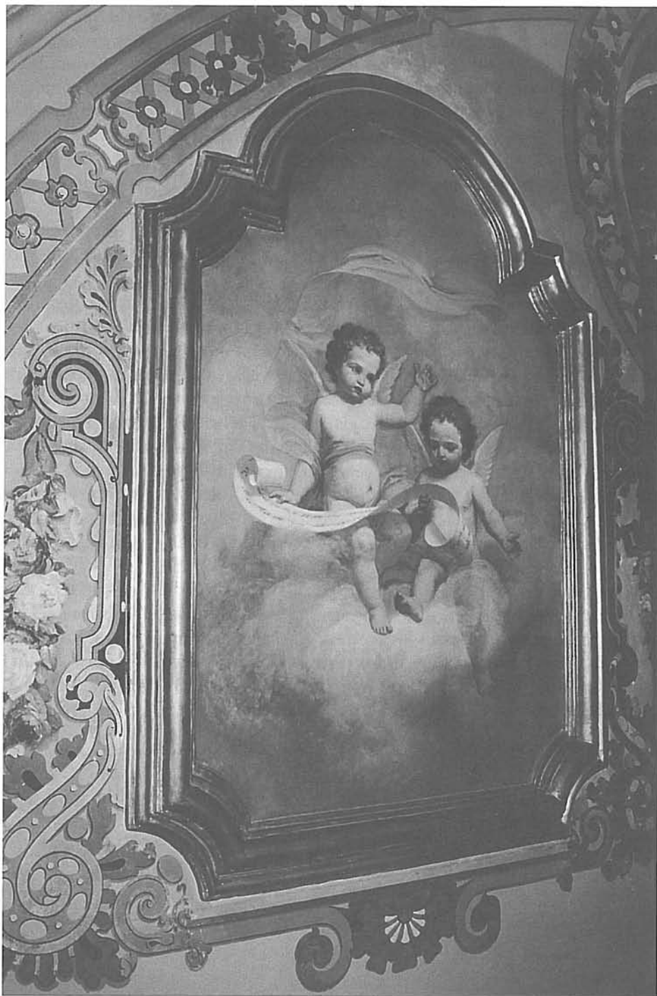
Fig. 4. Àngels nens cantors. Capella de la Mare de Déu de Gràcia. Lloret de Mar.