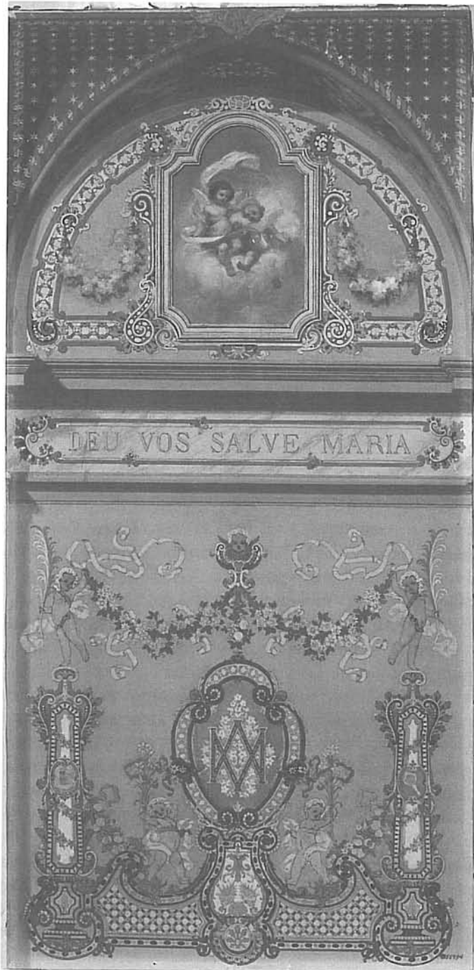
Fig. 3. Projecte de decoració mural. Museu d'Art Modern.