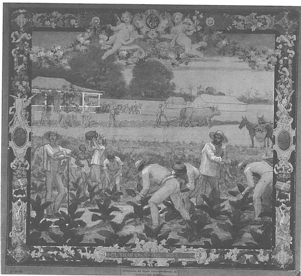
Fig. 2. Esbós d'una pintura, representant el cultiu del tabac.

-Esbós de pintura, representant la Sagrada Família. Aquarella i Oralina. 452 x 545 mm, núm. inventari 8226.