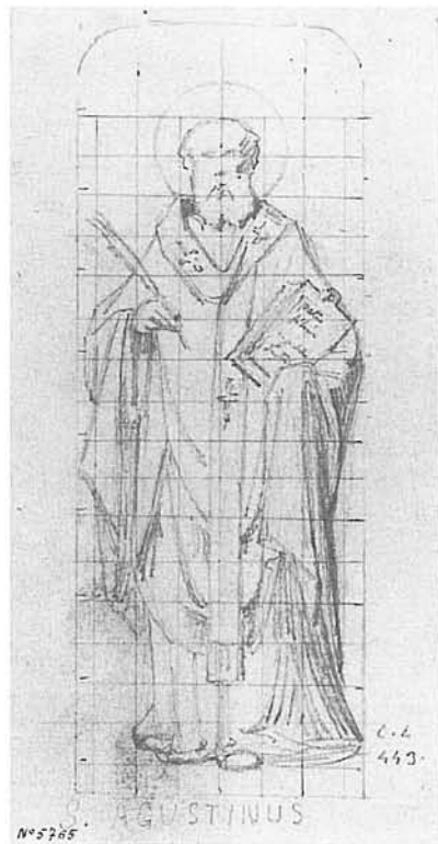
Fig. 5. Sant Agustí . Signat «C.L.», dibuixat amb llapis (219 x 107 cm). Gabinet de Dibuixos i Gravats del MNAC.

Donant un salt en el temps, trobem que l'any 1882 Josep Ferrer-Vidal i Soler 4 adquireix la propietat i realitza importants reformes estructurals, amb un estil de caire medievalista (torre, merlets, espitlleres,...), que alteraren el seu aspecte original; l'any 1896 féu construir una petita capella d'estil neogòtic, adossada al casal, sota l'advocació de Maria Auxiliadora, on es troba el retaule o tríptic, que per sort encara conserva la funcionalitat per el qual fou concebut.