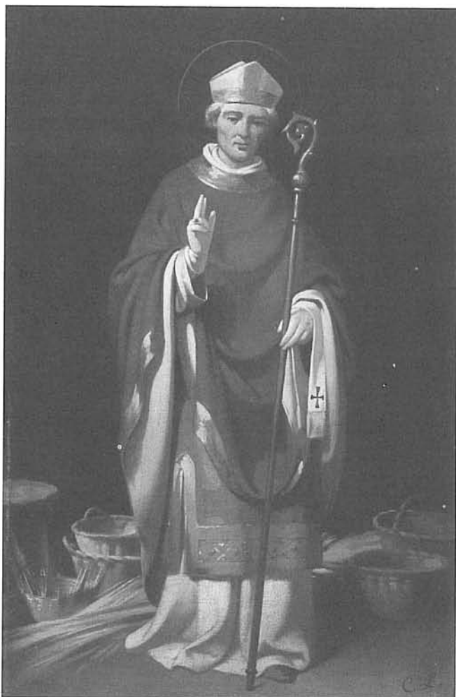
Fig. 3. Sant Julià. Col·lecció particular, Madrid.