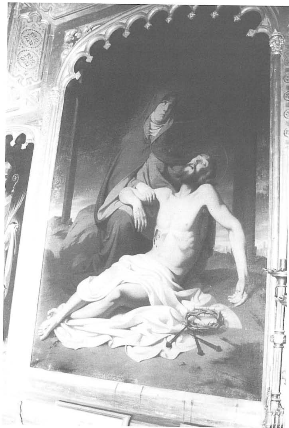
Fig. 6. Pietat . Torre del Veguer.