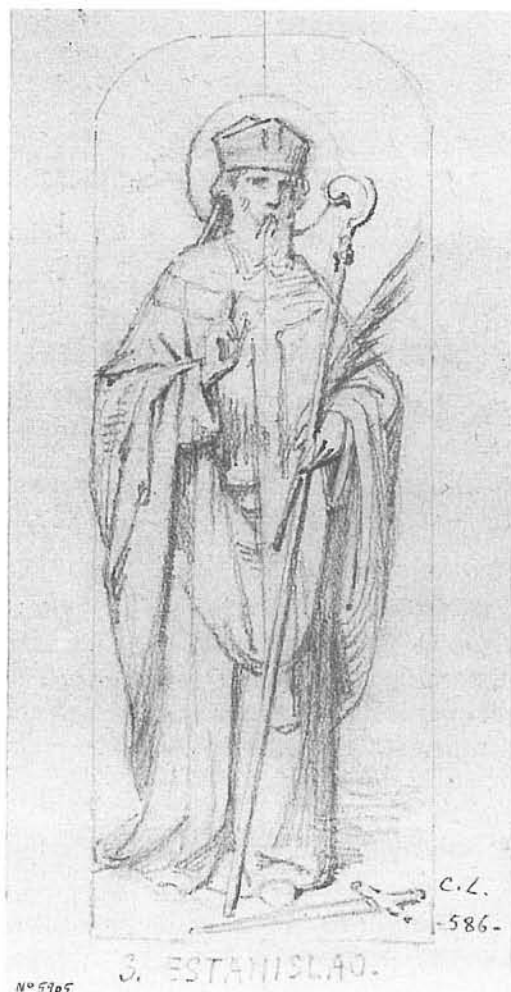
Fig. 2. Sant Estanislau . Signat: «C.L.». Dibuix amb llapis (218 x 108 cm). Gabinet de Dibuixos i Gravats del MNAC.

Aquestes característiques pictòriques, més o menys, les podem veure reflectides als quadres objecte del present estudi, realitzats pel pintor quan tenia seixanta tres anys, en plena maduresa artística.