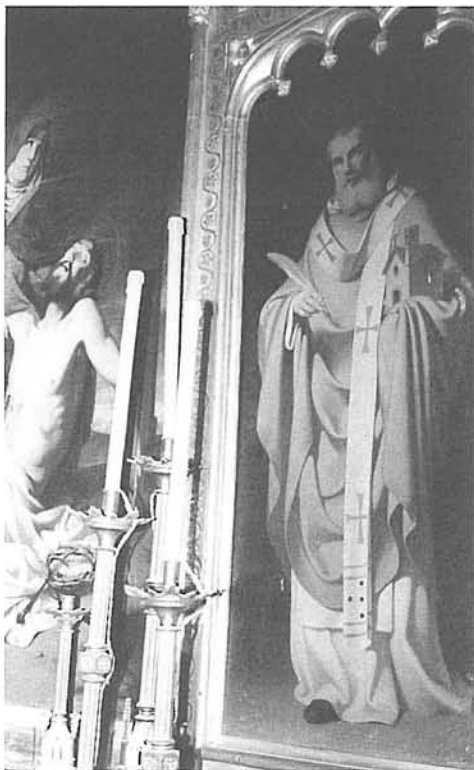
Fig. 4. Sant Agustí . Torre del Veguer.