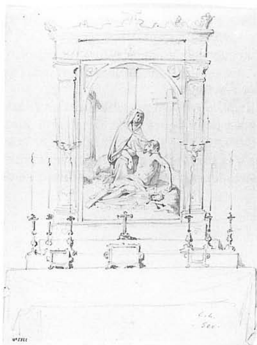
Fig. 8. Projecte de retaule. Signat «C.L.». Dibuix amb llapis (265 x 208 cm). Gabinet de Dibuixos i Gravats del MNAC.