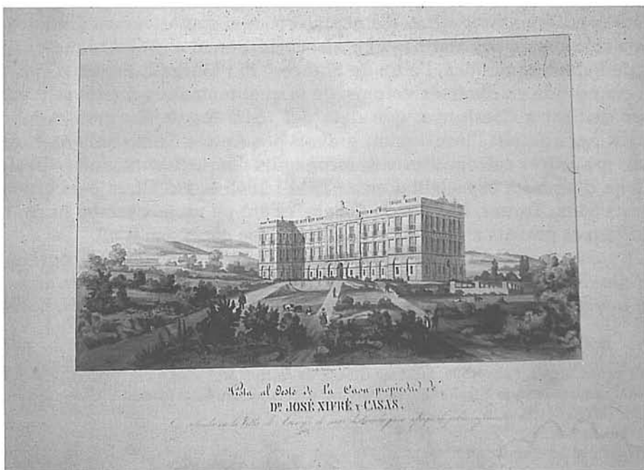
Figs. 1/2.- Vistes litogràfiques de les façanes est i oest de l'Hospital d'Arenys de Mar, estampades a París, a partir dels dibuixos realitzats per Lluís Rigalt el 1846. Arxiu Històric Fidel Fita, Arenys de Mar.