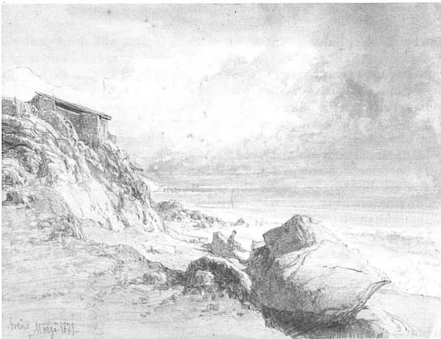
Fig. 3.- Lluís Rigalt, Les roques d'en Lluc. Arenys de Mar (1873). Llapis i aiguada. Reial Acadèmia Catalana de Belles Arts de Sant Jordi, Núm. 1096/D.