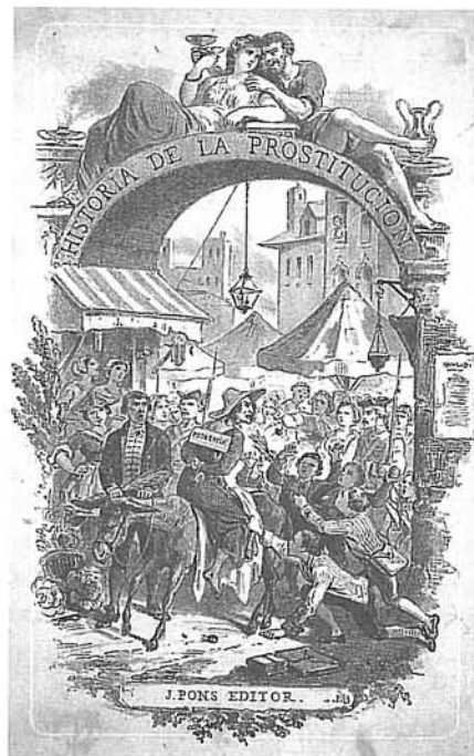
Portada litogràfica de Historia de la prostitución , J. Pons Editor, Barcelona, 1874.