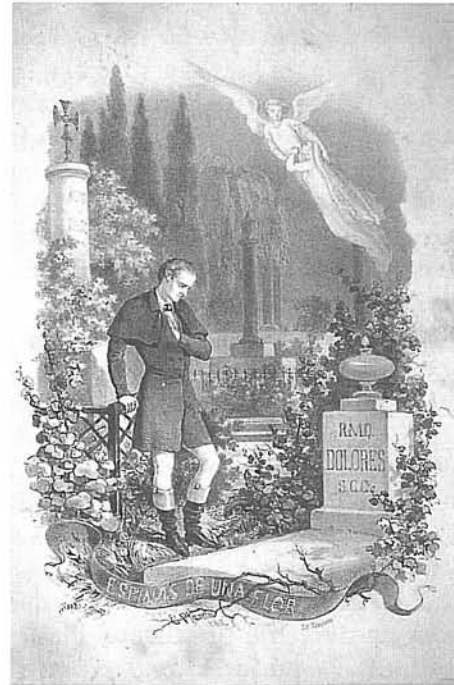
Portada litogràfica de Espinass de una flor , Imp. Lòpez Bernagossi, Barcelona, 1862.