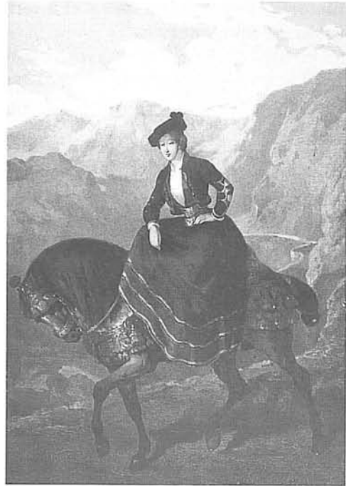
Retrat de la comtessa Eugenia de Montijo, el primer treball litogràfic original realitzat per Planas a París el 1851.