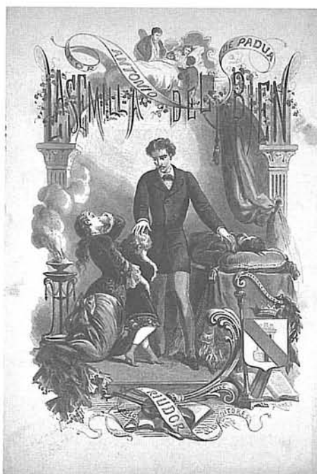
Portada xilogràfica de La semilla del bien , A. Riudor y Cia, Barcelona, 1878.