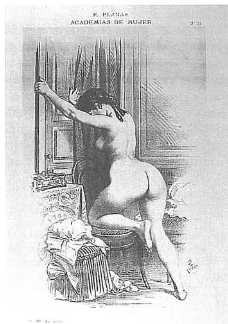
Làmina litogràfica de l'àlbum Academias de Mujer , Aleu y Fugarull, Barcelona, 1883-84.