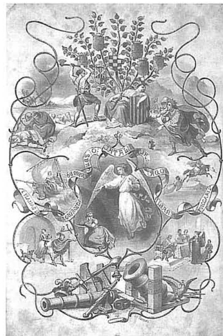
Portada litogràfica de L'orfaneta de Menàrquens o Catalunya agonisant , Librería Española/ Librería Plus Ultra, Barcelona, 1862.