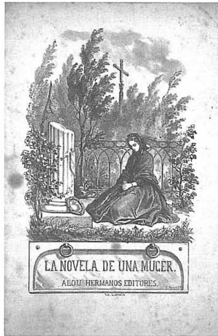
Portada litogràfica de La novela de una mujer , Alou Hnos Editores, Barcelona, 1859.