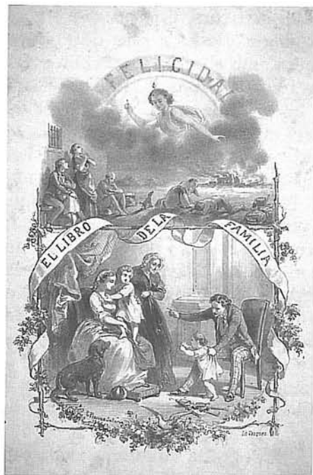
Portada litogràfica de El libro de la familia , Pérez García Editores, Barcelona, 1864.