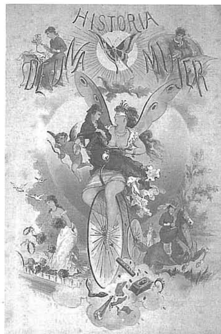
Portada cromolitogràfica de Historia de una mujer , Aleu y Fugarull, Barcelona, 1880.