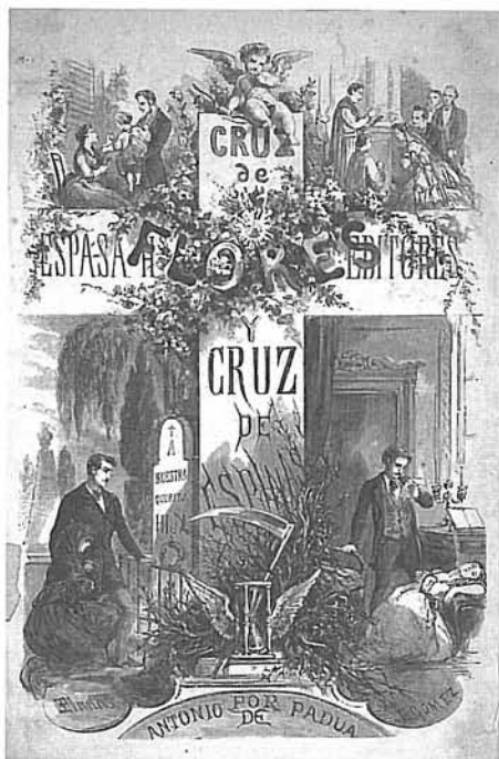
Portada xilogràfica de Cruz de flores, cruz de espinas , Est. Tip. Espasa Hermanos, Barcelona, c. 1880.