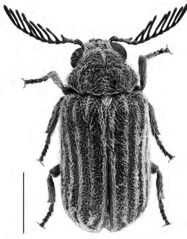
Figura 1. Habitús del ♂ de Clada (Clada) lineata Pic, 1897 de Ninh Binh, Vietnam. Escala = 2 mm.

molt desenvolupats, sortints i amb pubescència molt aparent; antenes d'onze artells, el segon més llarg que ample, el tercer dentat i del quart a el desè fortament pectinats; últim artell dels palps maxil·lars petit, de contorn corbat i afuat cap a l'àpex. Protòrax fortament transvers, 1,52 vegades més ample que llarg, amb la seva màxima amplada a la part mitjana; gibós a la part central i amb dues depressions, poc indicades, a cada costat; marges laterals fortament corbats; angles anteriors i posteriors molt arrodonits i gens indicats; superfície amb fort i dens puntejat. Escutel triangulat, amb l'àpex arrodonit i cobert totalment de densa pubescència. Èlitres de con-