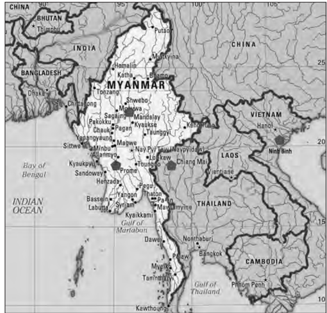
Figura 3. Mapa de la distribució de Clada (Clada) lineata Pic, 1897, amb indicació de les localitats conegudes.

Descrita de Myanmar (Birmània) sense localització precisa, hem pogut estudiar espècimens de Mandalay i Prome