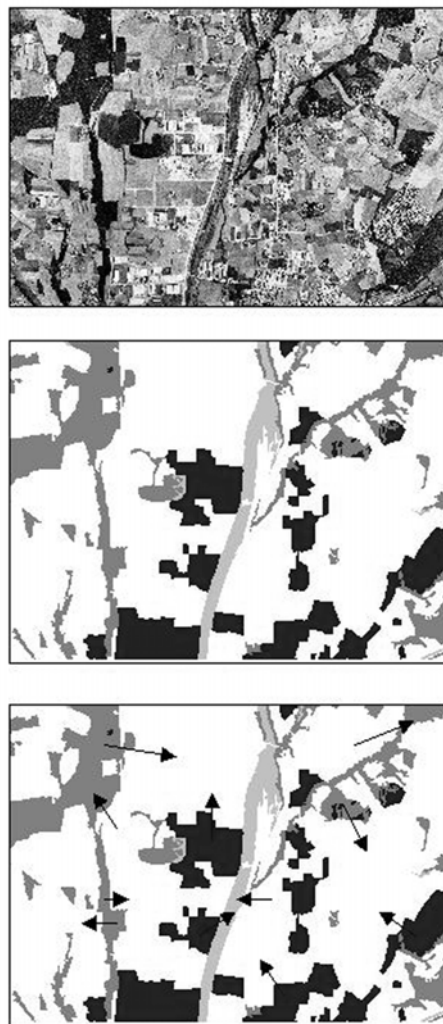
FIGURA 1. Tres concepcions complementàries del paisatge. La percebuda (a dalt) incorpora els aspectes més estètics i visuals del paisatge. L'estructural (al mig) considera el paisatge format per diversos elements (en aquest cas diverses classes de cobertes del sòl). La funcional (a baix) té en compte no només l'existència d'aquests elements, sinó també les relacions i els fluxos entre ells (representats per fletxes).

La utilització del paisatge com a marc de treball es recolza en un conjunt d'unitats que, de forma genèrica, han estat anomenades elements del paisatge ( landscape elements , Forman & Godron, 1986). La unitat espacial mínima dins un determinat paisatge ha estat