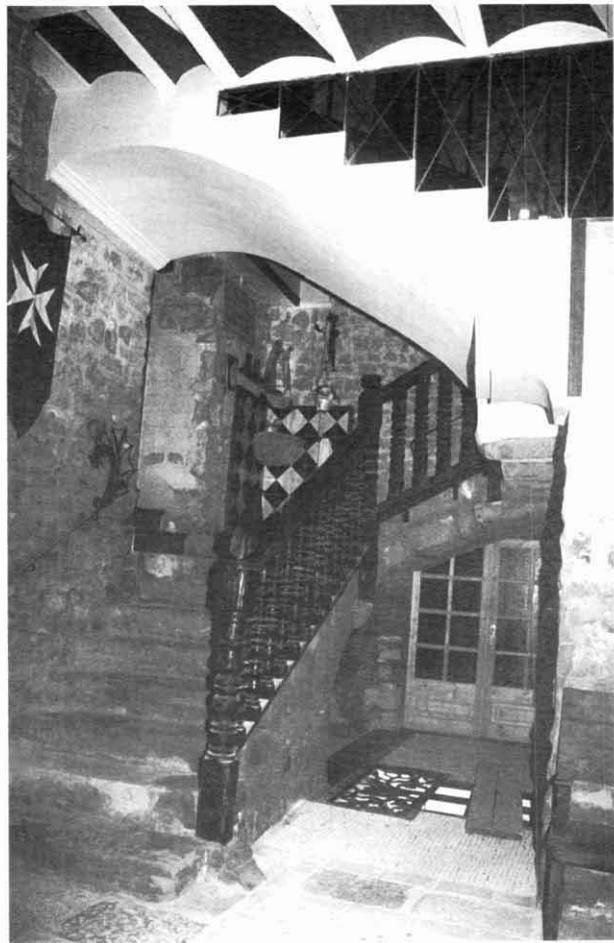
Casa Coll, escala principal.

de 1936 i substituïda provisionalment en l'actualitat per un ample vitrall.