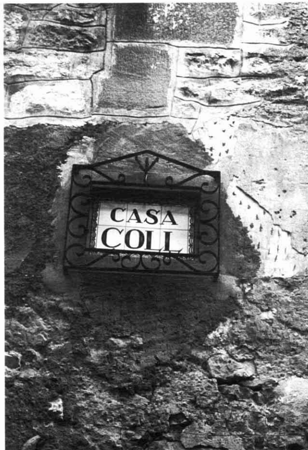
Rètol a la façana del carrer del Gall.

L'interior de la planta noble, com es gairebé una constant en cases de similars condicionaments, s'ordena en tres salons, els quals obren a la façana principal: el de protocol, al centre, i dos de laterals que tenen annexos sengles dormitoris. Un d'ells és l'anomenada «habitació de les dues alcoves», tan freqüent a les nostres cases catalanes, estava destinat a hostes i en ell va pernoctar i tenir el seu despatx el general Cabrera. Anys més tard faria el mateix el que