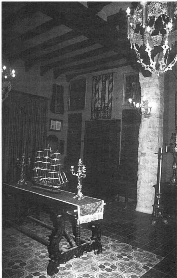
Sala noble a Casa Coll.

En ella vàrem presentar una petita comunicació en la qual reivindicàvem la recuperació del «Camí Xacobeu de l'Ebre», com a ruta de pelegrinatge a la tomba de l'Apòstol. Aquest camí