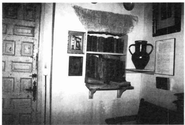
Casa Coll, documents històrics.

Al mateix oratori, hi ha exposada una nombrosa col·lecció de goigs en alabança de Santa Maria Magdalena, tots ells cantats a Catalunya, que ens parlen de la devoció de Vilalba envers aquesta Santa, la qual canvià el pom de perfums per la calavera de l'erm, i l'ermita de la qual, situada prop de l'Ebre a més de 20 km de distància, peregrinem tots els anys els vilalbins, per demanar a la Santa convertida «la salut del cos i de l'ànima», configurant una de les romeries més llargues i de major sabor ancestral de tot Catalunya.