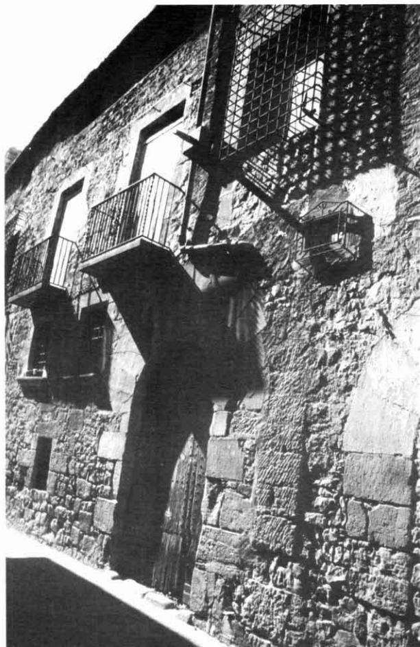
Casa Coll, façana al carrer del Gall.