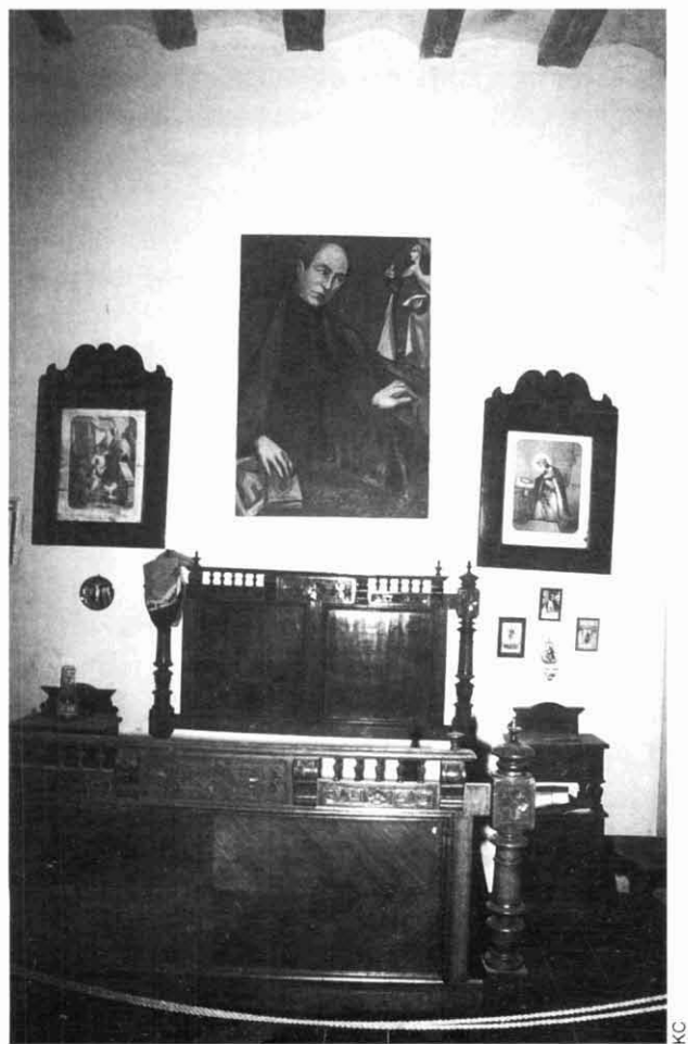
Cambrà de Sant Enric d'Ossó a la Casa Coll.