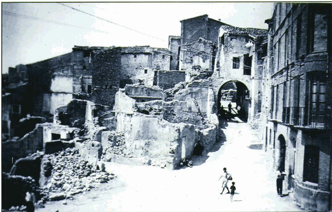
Cases caigudes a la Plaça del Pinell de Brai