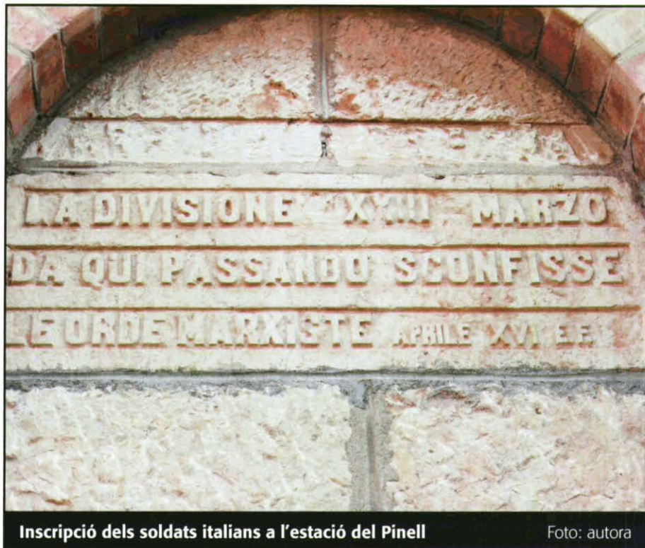
Inscripció dels soldats italians a l'estació del Pinell

la pitjor desgràcia. El germà de l'Antònia només tenia 17 anys i era de la quinta del 42, però pel seu aspecte físic n'aparentava més. L'exèrcit de la República havia mobilitzat el joves de la quinta del 41 i una patrulla va agafar el noi perquè van pensar que tenia edat d'estar a l'exèrcit (no van servir de res les explicacions de la famí-