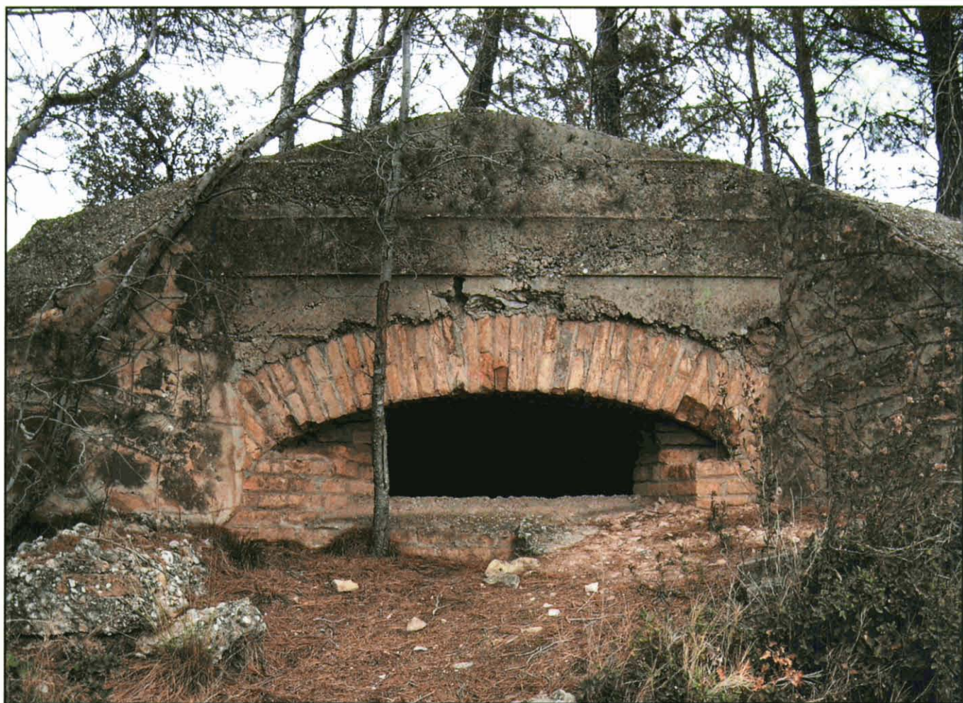
Fort de Sorio, Caseres