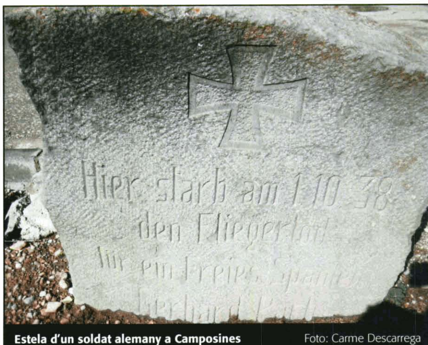
Estela d'un soldat alemany a Camposines