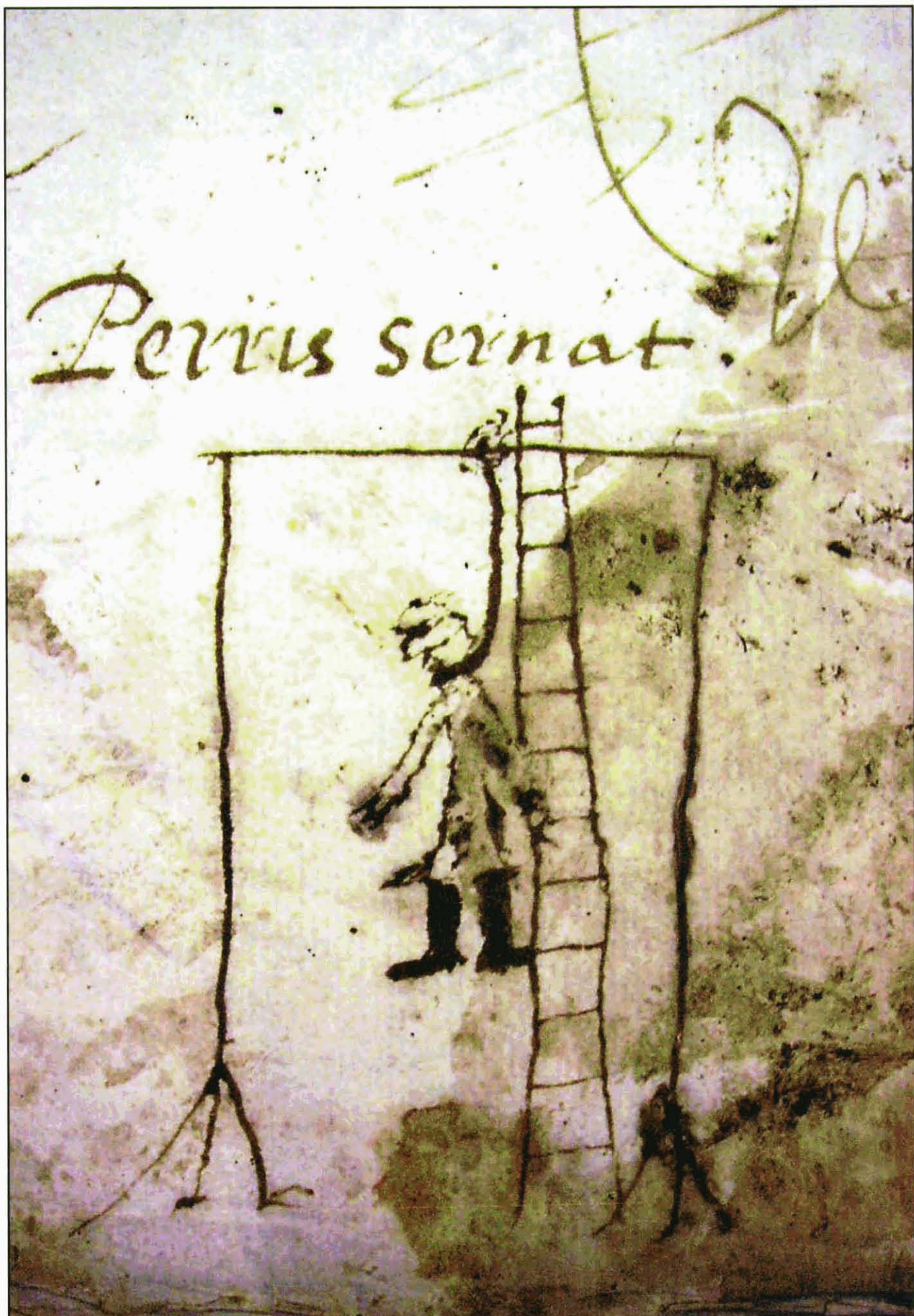
La mort a la forca era un dels destins més comuns reservats als bandolers d'època moderna quan eren capturats per les autoritats