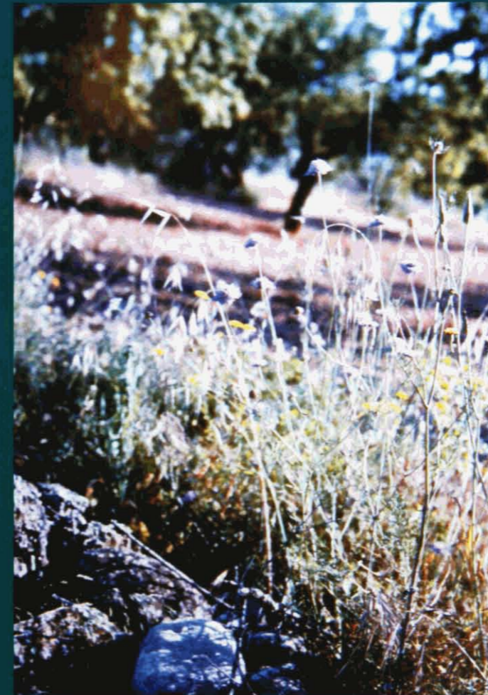
Escabiosa marítima - Scabiosa maritima