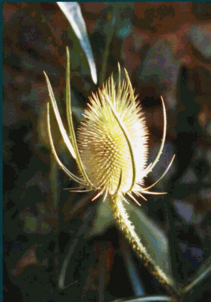
Escardot - Dipsacus fullonum