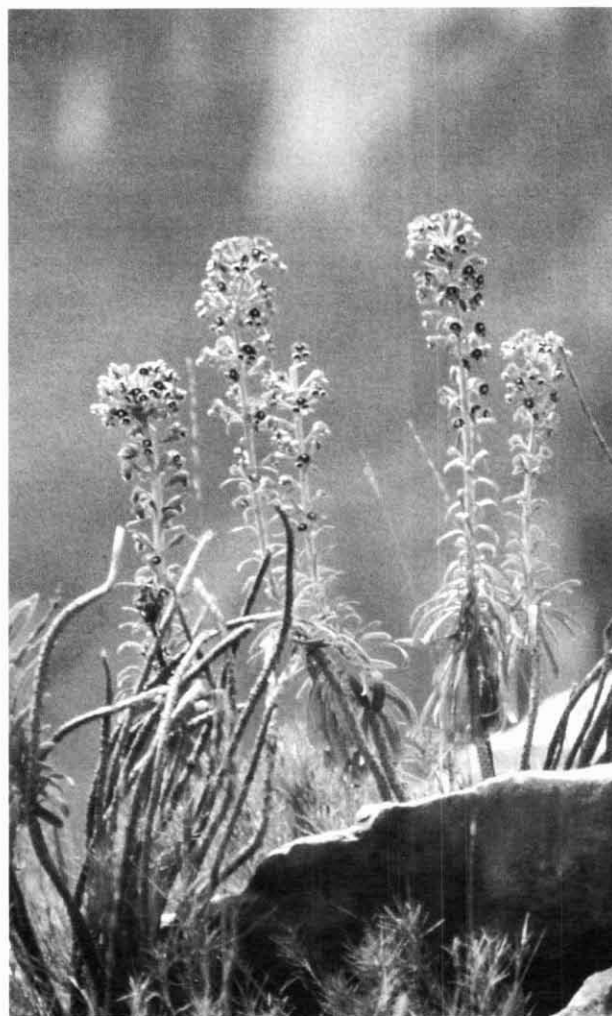
Elèbora fètida, Helleborus foetidus

En aquesta darrera obra se'ns donen una sèrie de mapes i quadrícules que ens permeten localitzar perfectament cadascuna de les espècies vegetals comentades.