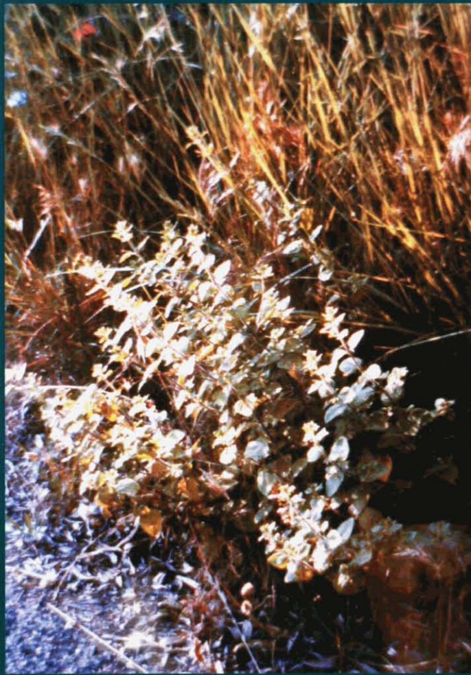
Calamenta - Satureja calamiontha

Amb els noms populars coneguts a la comarca. La informació completa de cadascuna d'aquestes plantes la trobareu a l'obra del Dr. Pius Font i Quer Plantes Medicinals. Dioscòrides renovat .