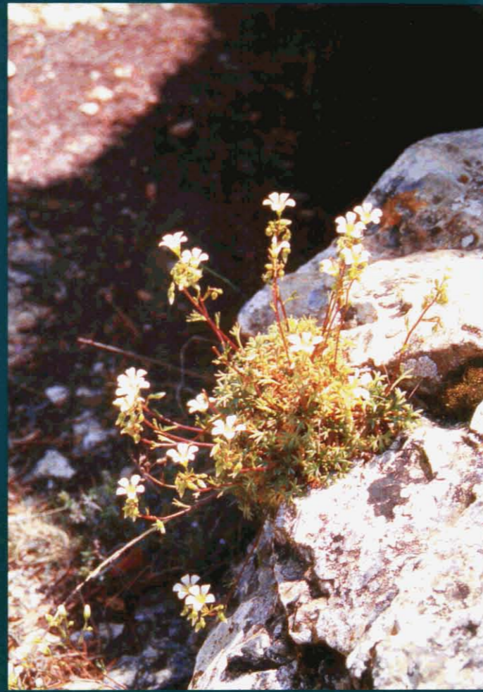
Salsufragi - Sylene saxifraga