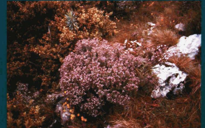
Timó - Thimus vulgaris