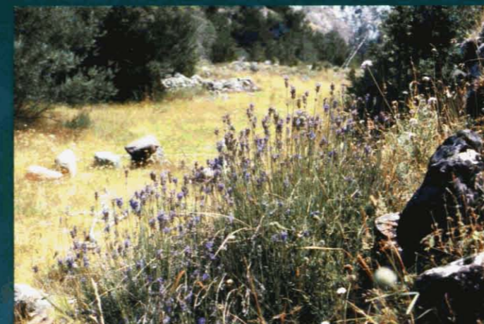
Espígol - Lavandula spica