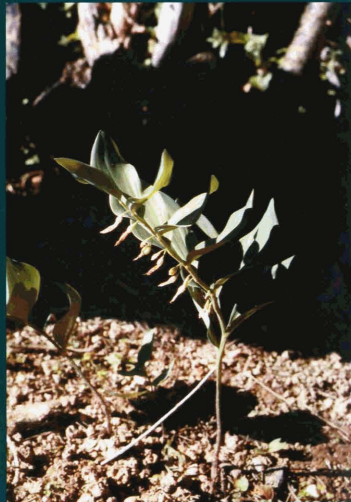
Beata Maria - Polygonatum odoratum