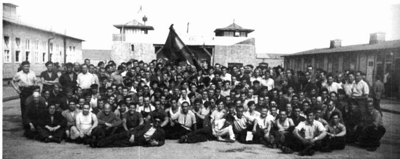
Espanyols que van sobreviure amb el cartell de benvinguda als aliats, Foto de Francesc Boix extreta del llibre Francesc Boix, el fotògraf de Mauthausen , ed. La Magrana. Barcelona. 2002