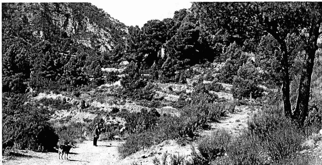
Antics marges de vinya, ara tot és verdissar. Terme de Prat de Comte