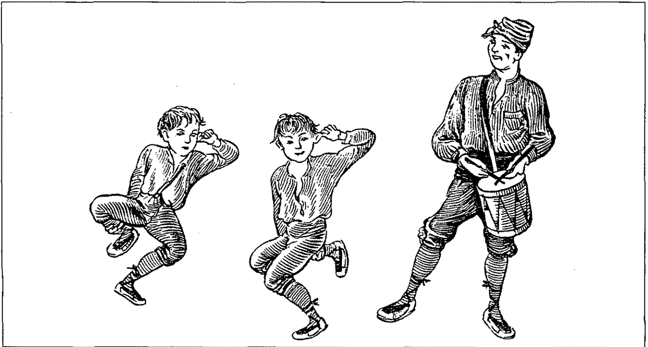
Ball del peuet.

«Antigament, així que es concertava un prometatge, la fadrina feia present al seu promès d'un mocador per al cap que variava en quantitat i riquesa segons els mitjans de la parella. El dia d'avui, a la plaça, feien un ball dedicat únicament a les parelles de promesos. Ells es deslligaven del cap el mocador que havien rebut en present de l'estimada i que havien lluit durant la festa. L'estenien amb tota cura a terra i ballaven airosoament per la seva vora en honor i gràvia de la promesa que els feia de parella en el ball. Si involuntàriament trepitjaven el mocador, per poc que fos, hom creia que el prometatge no acabaria en casament, i que si hi arribava, el matrimoni fóra desgraciat.» (Amades, 1982:711)