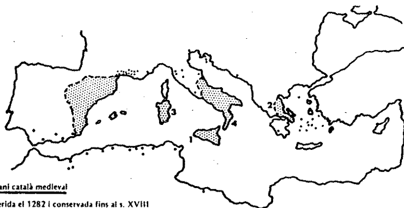
Imperi Mediterrani català medieval

A mitjan segle XIV, la burgesia més adinerada de les ciutats controla el govern local i passa a ser protagonista de la història. Aquesta classe, emparada per la monarquia i seguida per la noblesa es llança a la conquesta del comerç internacional Mediterrani i Atlàntic enllà, recolzats en una producció tèxtil relativament bona i en una agricultura al rera país; així es creà un Imperi que s'estengué per Sicília, Sardenya, Nàpols i arriba fins a Grècia.