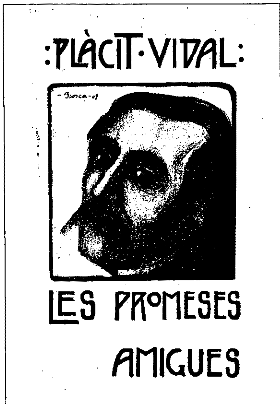
Portada del llibre Les promeses amigues , on queda reflexat el pes de l'avellana en l'economia alcoverenca a principis del S. XX