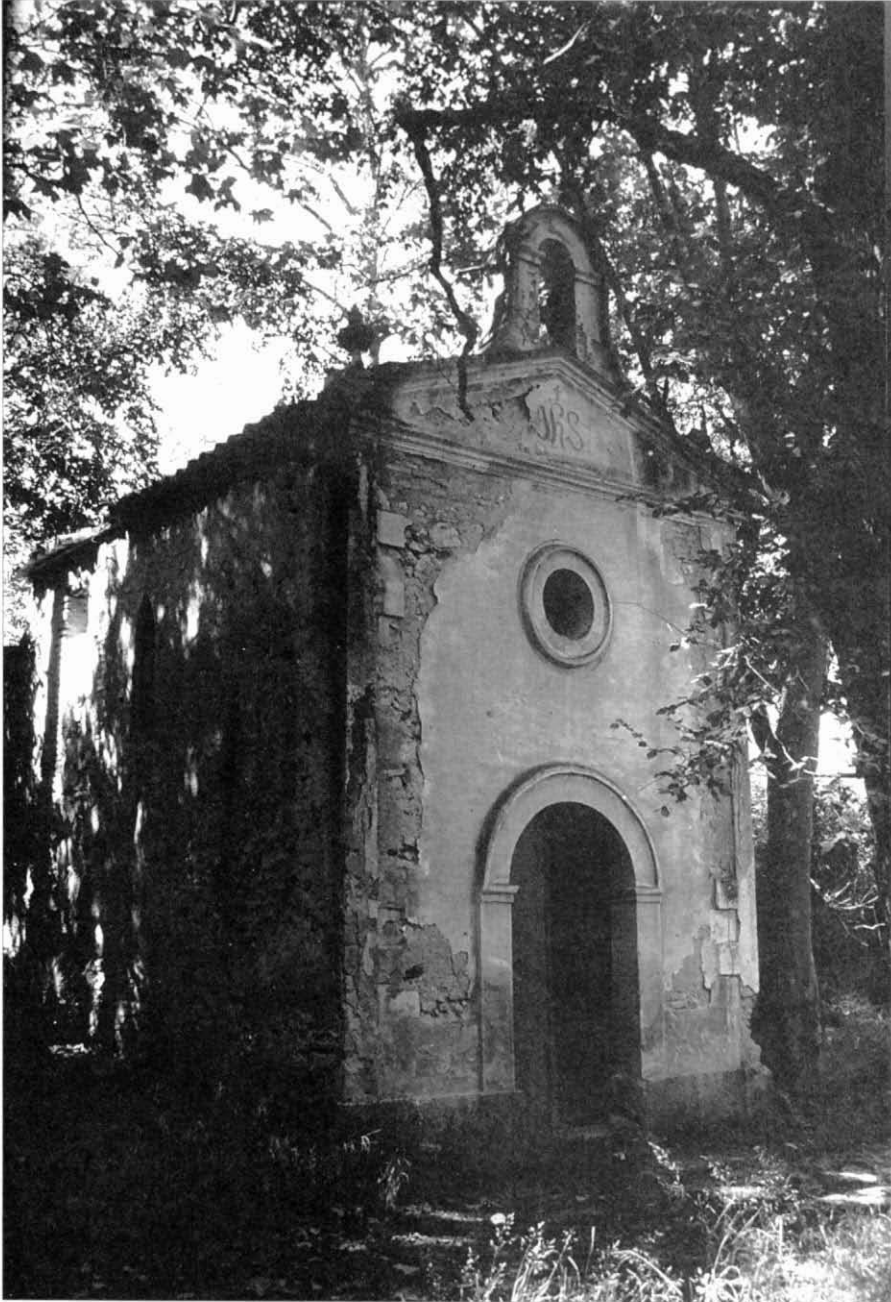
Ermita del Sagrat Cor de Jesús