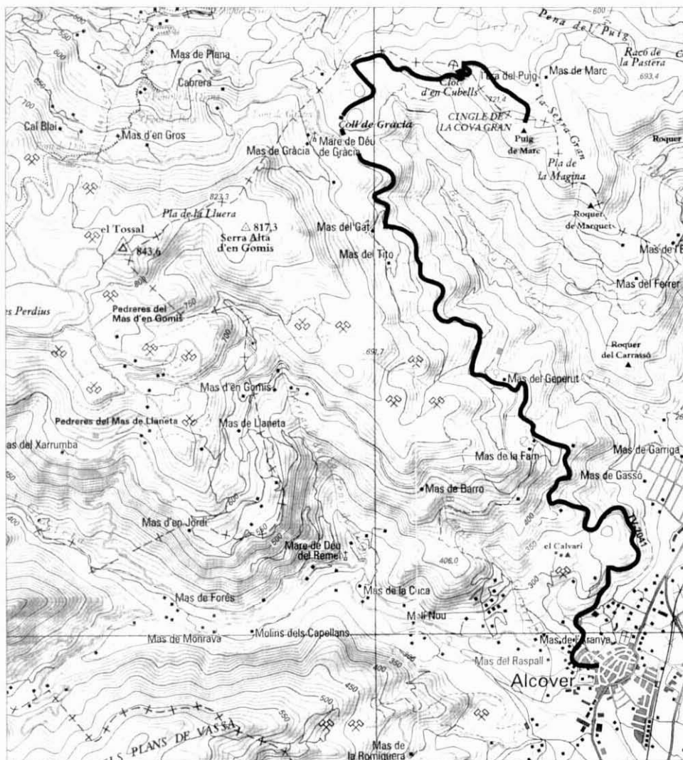
Tercera ruta: el Puig d'en Marc.

una pluja fina que es va convertir en intensa quan vam tornar cap a Alcover amb cotxes.