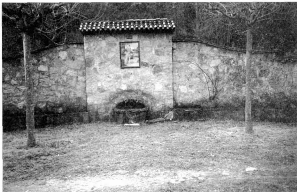
Font de la Diana