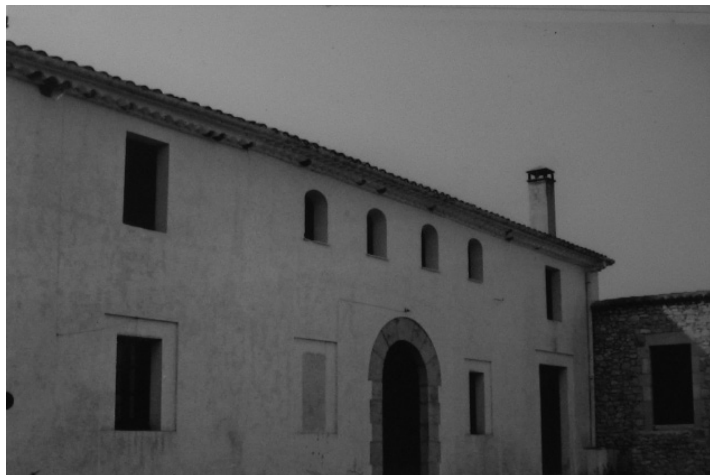
Façana principal de la masia original. 23 d'abril de 1966.

A Jaume Artís el succeí el seu fill Montserrat , casat amb Elisabet . Ells dos engendraren sis fills, el primogènit dels quals fou l'hereu, Pere Artís , nat el 1572.