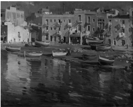
Barques a la platja, enfront de la façana marítima. 1958