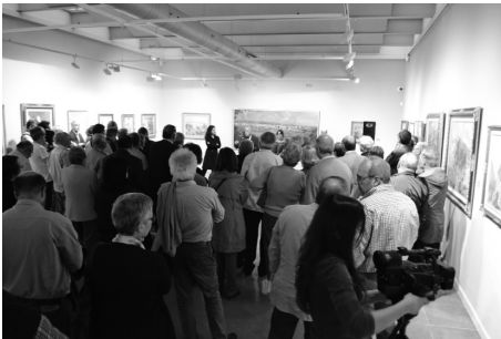
Acte d'inauguració de l'exposició Centenari P. Roig Estradé. Maig del 2014