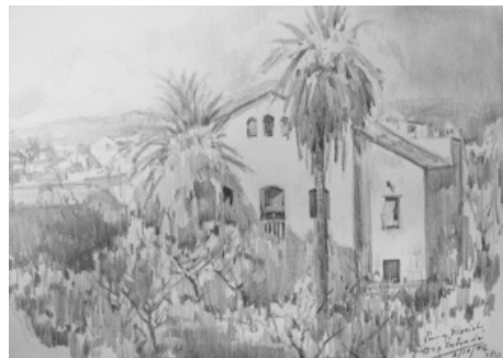
Sínia Rosich Dibuix a llapis