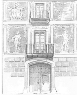
Casa Coloma Dibuix a llapis

Ja he esmentat que, entre els actes del centenari, entre el 17 de maig i el 25 de juny de 2014, la Penya Filatèlica presentà una exposició de dibuixos de detalls arquitectònics o ornamentals o d'elements complementaris d'edificis de Vilanova: un relleu decoratiu o un esgrafiat d'una façana, la configuració o una pedra esculpida de l'arc d'una portalada, un element realitzat amb forja d'una barana, una gàrgola, el pany o el treball de fusta