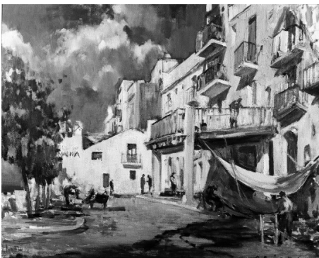
El terrat del Passeig Marítim. 1979

Vilanova i la Geltrú entre el 15 de maig i el 31 d'agost. Ens en podem sentir satisfets.