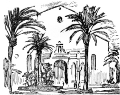
Plaça de les Neus. 1940 Dibuix a ploma