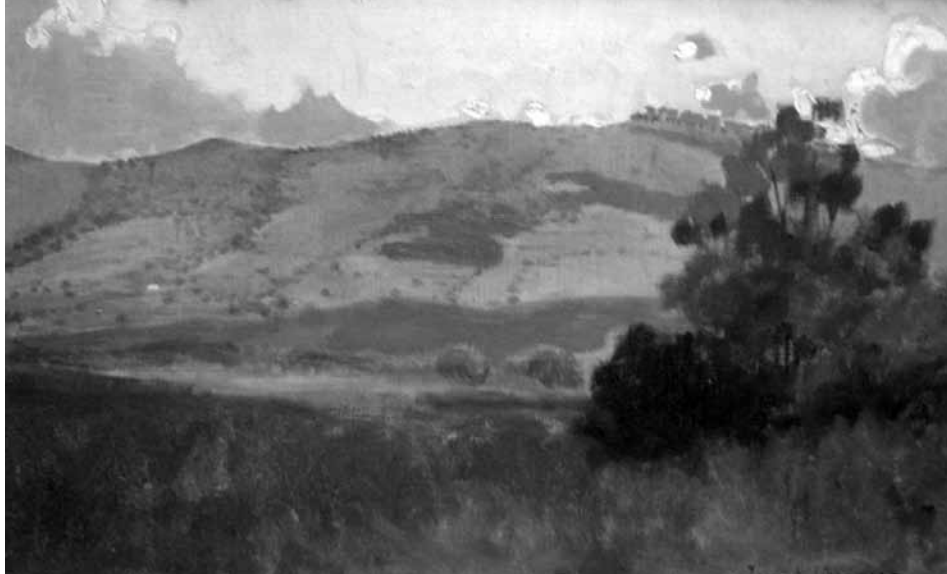
Paisatge, Joan Llimona (1860-1926) Pintura sobre tela 36,5x55 cm