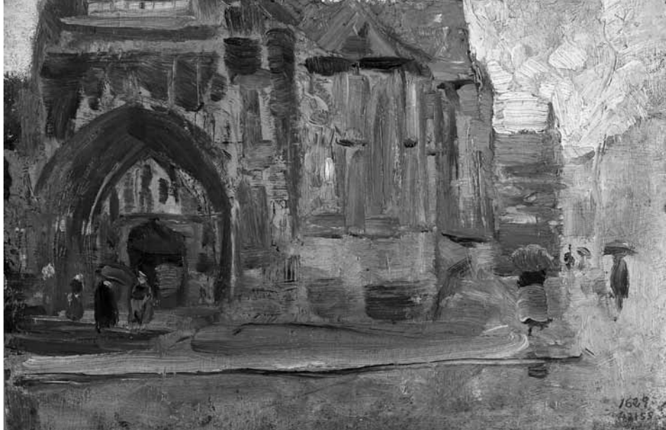
Nôtre Dame des Victoires , 1884 Santos Darío de Regoyos Oli sobre taula 18,5x25 cm