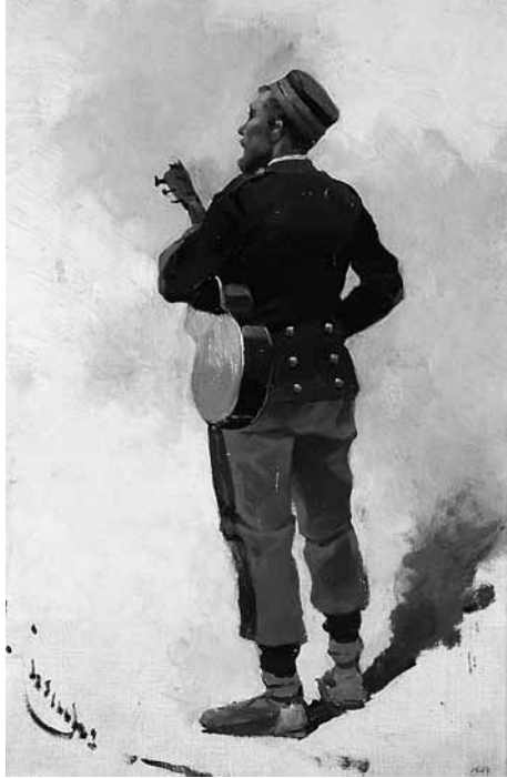
Soldat, 1908 Josep Cusachs Oli sobre tela 53x35 cm

del Museu, on el trobem actualment. L'edifici començava una època capitanejada per una destacada remodelació inaugurada el 1996 i el Llegat s'hi exposà seguint un ordre cronològic capaç de dialogar amb la resta del fons pictòric.