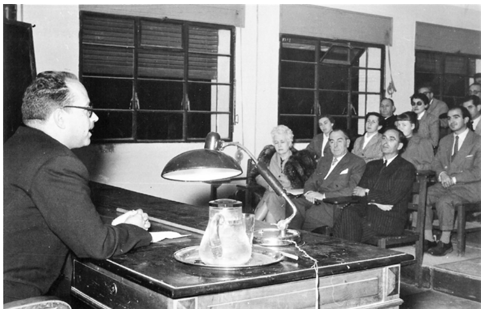
Figura 1. Dues imatges del Dr. Miquel Tarradell i Mateu pronunciant sengles conferències, els anys 50 del segle passat.