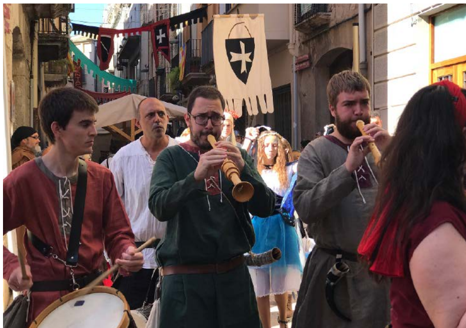
Figura 1. Feria medieval de Banyoles.