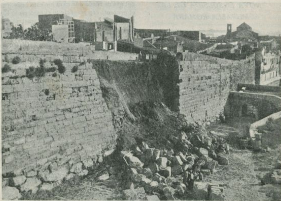
Aspecte del pany de Muralla, moments després de produir-se l'esllevissament

encertades actuacions en el camp de l'arqueologia, i al qui es deu el primer inici de l'actual Passeig Arqueològic en treballar perquè la Falsa Braga fos cedida a nostra entitat «para que en su recinto se establezca, a fin de poder ser visitado, el Museo Arqueológico» i, además, oferí el seu concurs per a evitar els inconvenients derivats de que les cases adosades a la muralla ocupin el pas de ronda.