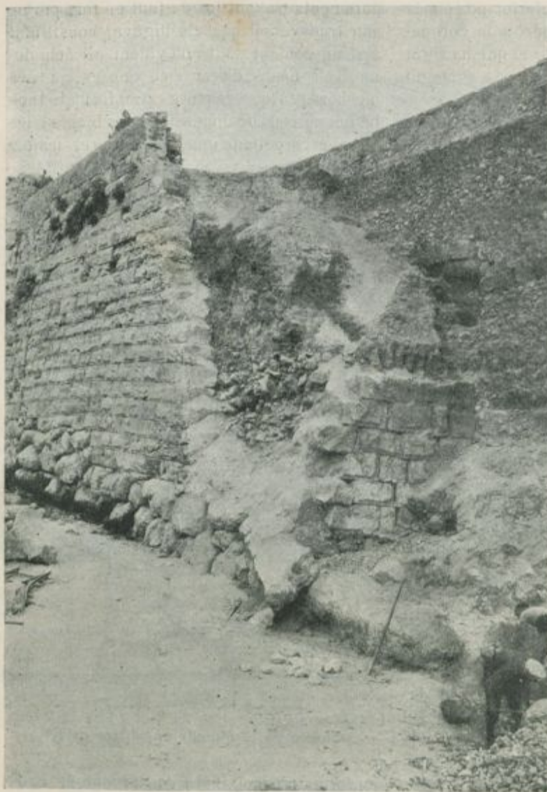
Vista de l'interior de la Muralla després de desenrunada

dicions de solidesa els paraments que la formen; però allà on s'ha terraplenat solsament amb terres sense la precaució de piconar-les, al empapar-se d'humitats, siguin de pluja o be dels desguassos que s'hi abocan subverticament, indefectiblement s'ha de produir el cataclisme.