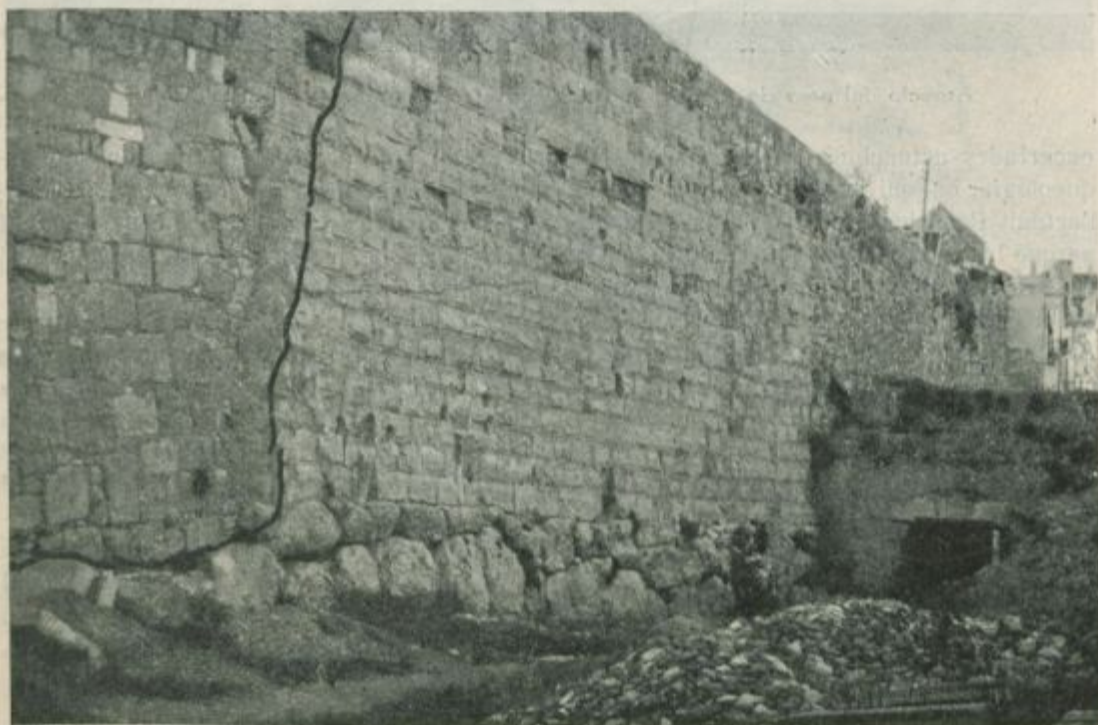
Pany de Muralla caigut

del pas de ronda a la gent molesta i que, fins el present, cap respecte ni consideració han tingut per la Muralla, i es possessioni a la Comissió de Monuments, o a l'entitat que vingui a substituir-la en les seves primordials funcions, d'aquell pas, fins avui sols accessible als depredadors, causa per la qual tranquil·lament han pogut gaudir abusivament d'un lloc que la Hisenda no ha venut mai, puix que quant s'intentà fer-ho, a l'any 1871, la Comissió de Monuments s'interposà, aconseguint que fos respectada en el tros comprés des de la Torre de Sant Domènec (encara avui existent en el Passeig de Saavedra) fins al Baluart de Sant Antoni, i, ademés, el llenç del desaparegut Baluart de Sant Climent (casa Cadenes) on hi ha la porta ciclòpea que dona accés al carrer de la Portella. I ja a l'any anterior la nostra Societat Arqueològica havia aixecat la seva protesta prop del Governador En Joan Manuel Martínez, de gratíssima recordança, per les seves