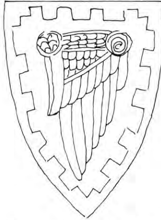
Escudo de la familia Marçal. (Dibujo de J. Jornet.)

La lectura cuidadosa del testamento permite descubrir nuevos aspectos, muy interesantes.