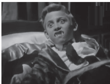
Figura 28. Niño vampiro en La Huella Macabra .

Hubo otras películas que trataron de abordar el vampirismo, pero la mayoría de ellas contribuyeron muy poco con relación al argumento o la estética. Algunas de estas películas fueron Rostro infernal y La huella macabra (1962), de Alfredo B. Crevenna, y El imperio de Drácula (1967), de Federico Curiel. Las dos películas de Crevenna fueron películas seriadas acerca del conde Brankovan, un vampiro que tomaba el poder y la inteligencia de los cerebros de sus víctimas y creaba autómatas —los cuales eran actuados por verdaderos luchadores del ring en las escenas de acción. En Rostro infernal , el vampiro es enterrado, pero en la secuela es desenterrado con la ayuda de un asistente y su nombre cambia por el de Theo van Korn, así como su rostro gracias al uso de una máscara para evitar que sea reconocido por sus viejos enemigos. En esta segunda parte, el vampiro regresa a la vida a un niño vampiro dándole a beber sangre (figura 28) y, entonces, planea su venganza.