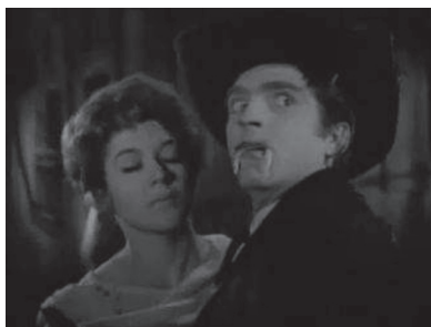
Figura 33. Vampiro vaquero en El pueblo fantasma .

Estas películas incluyeron a los actores Germán Robles y Aldo Monti, así como a otros actores, con las mismas características del conde Drácula que habían construido Méndez, Cardona y Corona Blake. Por esta razón, dichas películas contribuyeron a reforzar y a promover al conde Drácula como el estereotipo del vampiro en el cine mexicano. Finalmente, algunos westerns, tales como El charro de las calaveras , de Alfredo Salazar, y El pueblo fantasma (1965), de Alfredo B. Crevenna, también incluyeron a un vampiro como antagonista. En la primera película, el conde Drácula es confrontado por un charro mexicano y en la segunda película hubo por primera vez un vampiro vaquero, el cual chupaba la sangre de gente malvada y buscaba una amante vampira (figura 33). En comparación con otras figuras vampíricas, el vampiro vaquero tenía los colmillos más largos y combinaba la conducta de un joven tranquilo y asustado con la actitud del vampiro seductor y sediento de sangre.