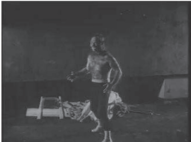
Figura 15. Monstruo-Luchador en Ladrón de cadáveres .

En la mayoría de los casos, el cine de horror mexicano combinó diferentes personajes fantásticos. Así, podemos encontrar ejemplos en los cuales un científico loco crea, por diferentes razones (descubrimiento científico, fama, venganza o poder), autómatas, zombis, robots, monstruos o seres poderosos tales como el hombre invisible, por ejemplo. Consecuentemente, esto llevó a la mezcla de ciencia ficción, horror y crimen. De acuerdo a Schmelz (2006: 39), un científico loco puede ser definido como «un hombre erudito que enloquece cuando se enfrenta a la vastedad del conocimiento y es llevado a realizar experimentos que desafían a la humanidad, la naturaleza, a Dios y a la imaginación». Tal como indicamos antes, muchas películas de horror y ciencia ficción incluyeron a un científico loco que precisamente se ajusta a esta definición y cuyos actos estaban motivados por objetivos malignos, pero también hubo otros ejemplos de científicos que eran engañados u obligados a usar la ciencia en favor de criminales. Así, en Ladrón de cadáveres encontramos a un científico que captura a un luchador y lo convierte en autómata con el cerebro de un gorila y una enorme fuerza física, pero al final el experimento se sale de control (figura 15). También, en Orlak, el infierno de Frankenstein , un científico, después de escapar de prisión, crea un autómata con los mismos rasgos faciales de un criminal. A su vez, el criminal usa al ser artificial para matar y cometer robos (figura 16).