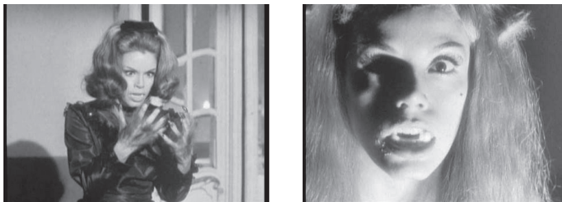
Figuras 13 y 14. Representación femenina del hombre lobo en La loba .

crúpulos. En contraste, en el cine de horror y sobre todo en la ciencia ficción, la figura femenina se convirtió en una sexualidad amenazante, el ser que venía del inframundo o de extraños planetas y quería devorar hombres o interactuar con ellos. En este caso, las mujeres eran independientes, a veces crueles y en otras ocasiones ingenuas, violentas y pragmáticas. De acuerdo a la época y los valores conservadores tales actitudes presentes en las mujeres vampiro señalaban su búsqueda por tomar el control que pertenecía a los hombres y, por tanto, debían ser castigadas. Además, las mujeres vampiro solían ser destruidas —en las formas tradicionales para eliminar a un vampiro— y las mujeres extraterrestres frecuentemente se enamoraban de los terrícolas y asumían el rol tradicional de una mujer humana en un mundo patriarcal. Sin embargo, el uso frecuente de este recurso temático, el retorno a los roles sociales tradicionales y la representación de mujeres fuertemente sexualizadas, independientes, extrañas y amenazantes exponen cómo la audiencia masculina y la industria fílmica —formada principalmente por hombres— concebía o deseaba mostrar a las mujeres al inicio de los años sesenta.