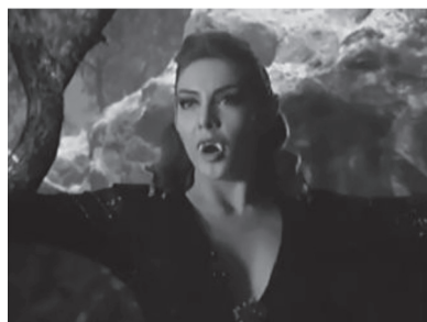
Figura 30. Vampira-extraterrestre en La nave de los monstruos .

De hecho, las películas de vampiros mexicanas favorecieron la aparición de mujeres vampiro. En el caso de aquellas películas en que el protagonista era una variación de Drácula, las mujeres vampiro jugaban el rol de