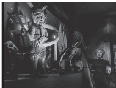
Figura 11. Ídolo del diablo en El espejo de la bruja .