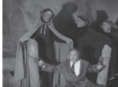
Figuras 17 y 18. Las vampiras lucen hermosas mientras que los vampiros tienen una apariencia animalesca y usan capas que usan como alas de murciélagos en El Mundo de los Vampiros .

El mundo de los vampiros también integra un elemento interesante relacionado con la destrucción de los vampiros: música. Cuando un joven que conoce las antiguas tradiciones de Transilvania toca una extraña melodía en un piano y los vampiros la escuchan, éstos son destruidos. Sin embargo, el conde Sabotai y su amante vampira sólo son detenidos por la melodía y súbitamente caen en un pozo lleno de estacas (figuras 19 y 20).