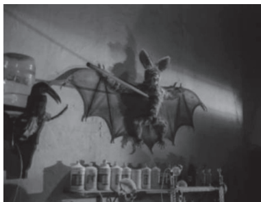
Figuras 23 y 24. El vampiro transformado en murciélago es clavado con una lanza en la pared en El Ataúd del Vampiro (Fernando Méndez, 1958) (izquierda) y en La Invasión de los Vampiros (derecha)

A pesar de los interesantes rasgos de las películas de vampiros de Morayta, éstas no tuvieron mucho éxito en comparación con otras películas suyas tales como La venenosa 4 (1949), Hipócrita (1949) o El mártir del calvario (1952). No obstante, sus dos películas muestran la influencia de Méndez y otros directores que hicieron películas de horror. Morayta exploró también diferentes géneros, tales como el melodrama, el ranchero, la comedia urbana, el cine de cabaret y de barrio y el horror. Además de estas películas, Morayta también hizo Dr. Satán (1966), una película acerca de un malvado científico loco que crea a un autómatas.