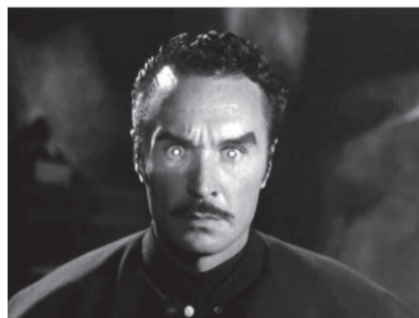
Figuras 21 y 22. El carruaje del vampiro en slow motion con niebla detrás y el efecto visual del eye-light sobre los ojos del vampiro en El Vampiro Sangriento .