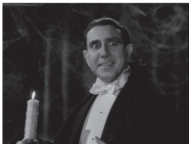
Figura 1. Carlos Villarías como el conde Drácula en la versión española de Dracula dirigida por George Melford.

español Carlos Villarías actuó como el conde Drácula en la versión hispana de Dracula dirigida por Tod Browning (figura 1) y luego como un científico loco en el cine mexicano ( El misterio del rostro pálido , El súper loco ). En el caso de El misterio del rostro pálido , Villarías personifica al doctor Forti quien realiza experimentos y usa ropa blanca, pero cuando enloquece usa ropa oscura, lo cual destaca su locura en la película (figuras 2 y 3). Por su parte, los actores españoles Julio Villarreal y José María Linares actuaron como villanos o científicos locos. Linares Rivas actuó como el doctor Ling, un científico loco cuyo rostro está desfigurado, realiza experimentos y crea un autómata (figuras 4 y 5) en El monstruo resucitado (Chano Urueta, 1953). El actor español Germán Robles, así como el argentino Guillermo Murray y el italiano Aldo Monti, representaron al vampiro (figuras 6, 7 y 8). Como regla, el mal tenía que venir del exterior y la manera de proyectar esto fue a través de la inclusión de un actor desconocido o poco conocido.