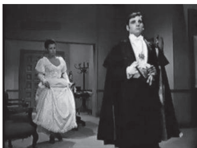
Figuras 25, 26 y 27. Representaciones mexicanas del conde Drácula (de arriba a abajo y de izquierda a derecha): conde Karol de Lavud, conde Sabotai y conde Drácula.

A diferencia de las películas de vampiros de Méndez, El vampiro y el sexo combinó ciencia ficción con horror e incluyó a un luchador como héroe: «Santo, el enmascarado de plata». En esta película «Santo» es un científico que crea una máquina para viajar en el tiempo, a la época de una vida anterior, a través de una descomposición molecular. Para ello, «Santo» usa a su novia como «conejiillo de indias». Así, ella viaja al pasado —experimentando una suerte de encarnación— y ahí ella es víctima de Drácula, pero antes de que el vampiro sea destruido, «Santo» hace regresar a su novia al presente. Sin embargo, algunos espías descubren lo ocurrido y el lugar en donde está la tumba