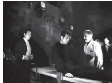
Figura 16. Autómata en Orlak, el infierno de Frankenstein .