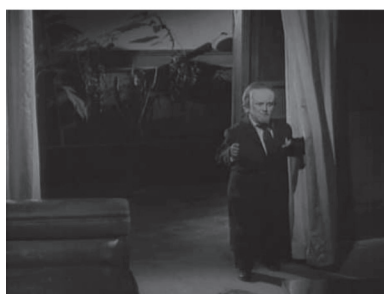
Figuras 9 y 10. Autómata (izquierda) en Rostro infernal (Alfredo B. Crevenna, 1962) y un muñeco zombi en Muñecos infernales (Benito Alazraki, 1960).