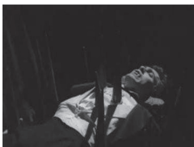
Figuras 19 y 20. Un pozo con estacas donde finalmente el conde Sabotai es destruido cuando cae en él.