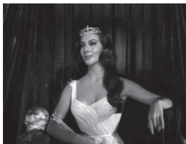
Figuras 31 y 32. Mujeres vampiro en Santo contra las mujeres vampiro .

También hubo películas que combinaron horror con comedia e incluyeron al conde Drácula como un falso vampiro o como el miembro de un grupo de monstruos. En el primer caso, una persona ambiciosa quería apoderarse de una herencia asustando a los herederos en una mansión en la cual éstos debían permanecer por una noche, como ocurrió en The Cat and the Canary , de Paul Leni. Algunas de estas películas fueron La casa de los espantos (1961) y Échenme al vampiro (1961), de Alfredo B. Crevenna. En otros casos, Drácula, el hombre lobo, la momia, el monstruo de Frankenstein y el monstruo de la laguna negra retornaban a la vida por intercesión de un científico loco, como ocurrió en El castillo de los monstruos (Julián Soler, 1958) y Frankenstein, el vampiro y compañía (Benito Alazraki, 1961). Estas películas fueron una parodia de las películas de vampiros en las cuales un comediante confrontaba y, la mayoría de las veces, destruía por casualidad a seres malignos. Asimismo, algunas películas de vampiros y lucha libre también incluyeron al conde Drácula como miembro de un grupo de monstruos que eran confrontados y destruidos por los más famosos luchadores del ring de los años sesenta, como fue el caso de Santo y Blue Demon contra los monstruos (Gilberto Martínez Sola-