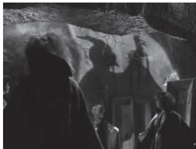
Figura 12. Sombra del diablo en Santo contra las mujeres vampiro .