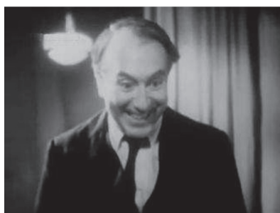
Figuras 2 y 3. Carlos Villarías como el doctor Forti antes y después de volverse loco en El misterio del rostro pálido .