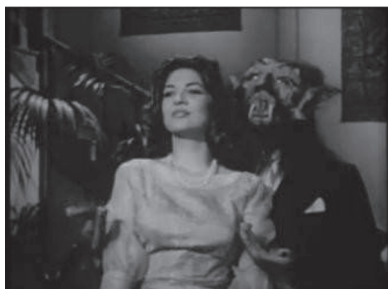
Figura 29. Brujo-vampiro-extraterrestre en El barón del terror .

también produjo la película—, un brujo perseguido por el tribunal de la Santa Inquisición que es condenado a la hoguera. Ante la condena, el barón promete regresar 300 años después con el paso del cometa para vengarse de los descendientes de sus enemigos. Así, en los años sesenta el barón aparece como un brujo extraterrestre que tiene unos largos colmillos como vampiro y una larga lengua para succionar los sesos de sus víctimas y enemigos (figura 29). Además, tiene poderes hipnóticos y puede atravesar cuerpos y paredes; sin embargo, el fuego puede destruirlo. De acuerdo a esta descripción, esta figura es una mezcla de diferentes rasgos de personajes fantásticos, tales como el brujo, el vampiro y el extraterrestre. Salazar estaba interesado en tal combinación para atraer mayor audiencia y aprovechar el éxito de la ciencia ficción hollywoodense en México. En este sentido, la película La nave de los monstruos (Rogelio A. González, 1960) fue otra película que combinó rasgos de vampirismo con extraterrestres a través de la inclusión de mujeres invasoras (figura 30).