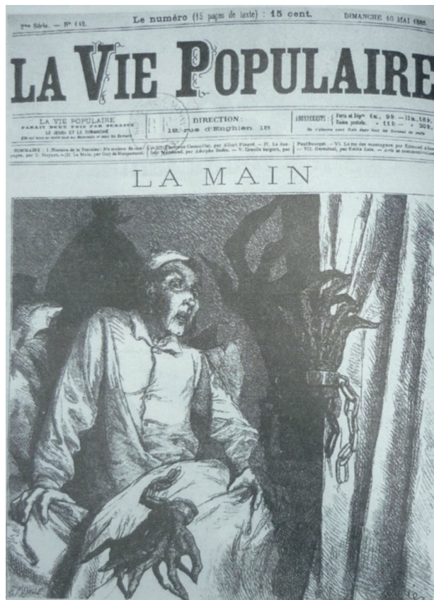
3. Illustrazione di Édouard Zier per la ripresa del racconto di Maupassant ne La Vie populaire , 10 maggio 1885.

Nel 1920 Violet dirige una riduzione 12 dal breve racconto di Guy de Maupassant, che era uscito in volume nel 1885, nella raccolta Contes du jour et de la nuit , dopo essere apparso su una rivista due anni prima. 13