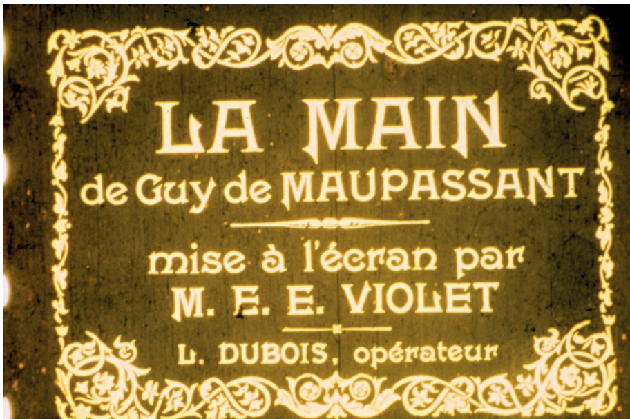
2. Fotogramma de La Main : titoli di testa (© Succession Édouard-Émile Violet).

duzione, con sede a Parigi, il cui nome delinea chiaramente la determinazione a seguire la strada del genere da parte di Violet e dei suoi soci: Les Films Lucifer. 11 Può essere annoverato tra gli iniziatori del cinema fantastico francese, benché la risonanza del suo nome e della sua opera restino marginali. Il suo lavoro si modella in parte sulla letteratura dell'insolito, poi, col passare del tempo, ripiega sovente verso il Grand-Guignol e infine si riavvicina parzialmente a un cinema più convenzionale. Nell'insieme di questo percorso ha saputo individuare delle modalità espressive specificamente cinematografiche e di una certa originalità per realizzare il suo cinema del perturbante. Originalità e specificità di cui il cortometraggio La Main offre qualche interessante campione.