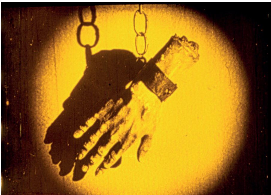
4. Fotogramma de La Main (© Succession Édouard-Émile Violet).

con il suo insistere sul feticcio, ripreso in piani dalla calcolata durata, ravvicinati e bene illuminati, evidenzia come «l'effet de "monstration" est différent de la simple représentation» (Bozzetto, 2005: 68). La costante latenza dell'ossessione, la suspense intorno al terrore che l'inanimato possa animarsi, l'inquietudine rispetto all'inconoscibilità della vera natura delle cose vicine o quotidiane sembrano vibrare in una tensione crescente all'interno delle inquadrature che indugiano sull'oggetto. Esse alimentano, paradossalmente, la fantasia dello spettatore intorno a una «cosa reale» che si confonde con un'altra «cosa», che è presente solo in potenza, ma che evoca una dimensione che è altro dal reale. La carica perturbante di questo tipo piani (i cui tratti principali sono la vicinanza, l'immobilità e la durata) è uno degli effetti specifici di cui il cinema fantastico può avvalersi, a differenza (e non solo) della letteratura.