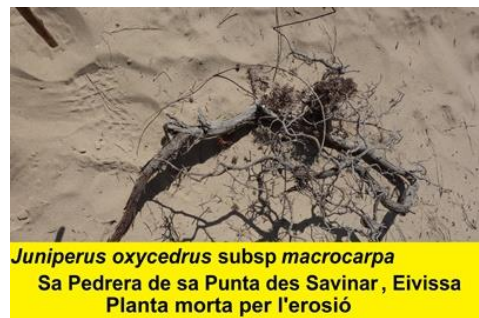
Juniperus oxycedrus subsp macrocarpa Sa Pedrera de sa Punta des Savinar, Eivissa Planta morta per l'erosió

Figs 4 i 5. Situació de diverses arrels de J. oxycedrus subsp. macrocarpa . L'erosió ha afectat al sistema radicular del ginebre de duna. Com que les arrels són prou llargues, no s'ha pogut determinar exactament el nombre d'individus. Es parla sobre el nombre de peus en aquest article.