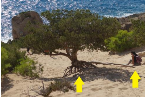
Fig. 3. Imatge d'un visitant arrossegant-se per la duna. El sòl es troba molt trepitjat. I a la savina de la imatge es pot esbrinar que la duna ha perdut un metre de substrate segons les arrels que mostra en l'aire

Fig. 3. Image of a visitor crawling across the dune. The soil is very trampled. And in the savina of the image you can find out that the dune has lost a meter of substrate according to the roots it shows in the air