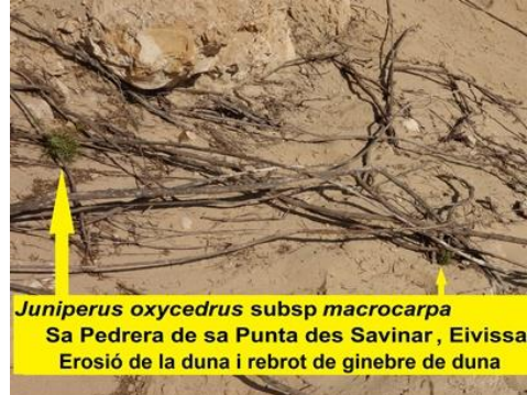
Juniperus oxycedrus subsp macrocarpa Sa Pedrera de sa Punta des Savinar, Eivissa Erosió de la duna i rebrot de ginebre de duna

4. Competència amb altres espècies vegetals per l'espai, de Salvia rosmarinus , Pistacia lentiscus , Pinus halepensis , Erica multiflora , Helichrysum stoechas i Juniperus turbinata .