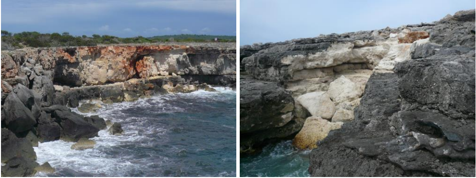
Fig. 1. Els denominats “blancs”, senyals de recents caigudes de blocs que encara no han estat colonitzades per cianofícies i/o líquens endolítics. Costa Sud de Ciutadella (esquerra). Costa S de Sant Lluís (dreta).

Fig. 1. Image of “whites”, signs of recent falls of blocks that have not yet been colonized by cyanophyta and / or endolithic lichens. South Coast of Ciutadella (left). Coast of Sant Lluís (right).