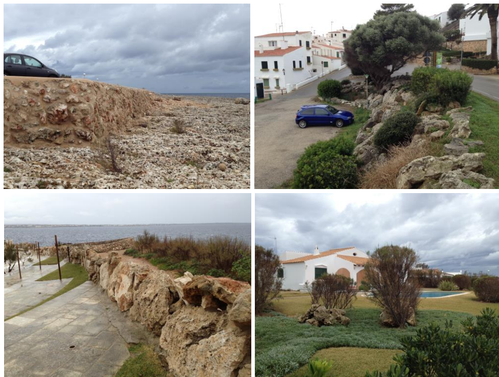
Fig. 4. Utilització de blocs associades per a reblits de carreteres (superior esquerre), estabilització de talussos (superior dreta), construcció de parets (inferior esquerra) o amb finalitats ornamentals (inferior dreta).

Aquest treball es configura com un document de partida sobre els processos erosius als penya-segats de Menorca que presenten activitat, amb base a la realització d'enquestes, i la ubicació de les