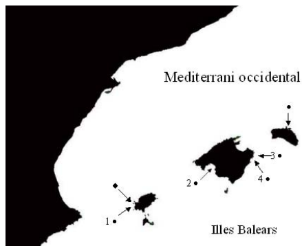
Fig. 1. Localització de les captures (●) i els albiraments (◆) de Fistularia commersonii . Els nombres identifiquen els individus de la Taula 1.

El primer individu (exemplar núm. 1 de la Taula 1) es va capturar durant un campionat de pesca submarina a Cala d'Hort (Eivissa) el 28 d'octubre de 2007. La segona captura (exemplar 2 de la Taula