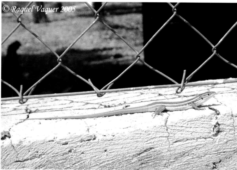
Fig. 1. Psammodromus algirus Linnaeus, 1759 de s'Espinagar (Manacor, Mallorca).

Un exemplar decomisat a Cabrera al maig del 2003, on havia estat portat per un alumne de l'escola de Porto Colom amb la intenció d'alliberar-lo (J. Oliver, com. pers.). L'animal va morir i es conserva al Servei de Protecció d'Espècies.