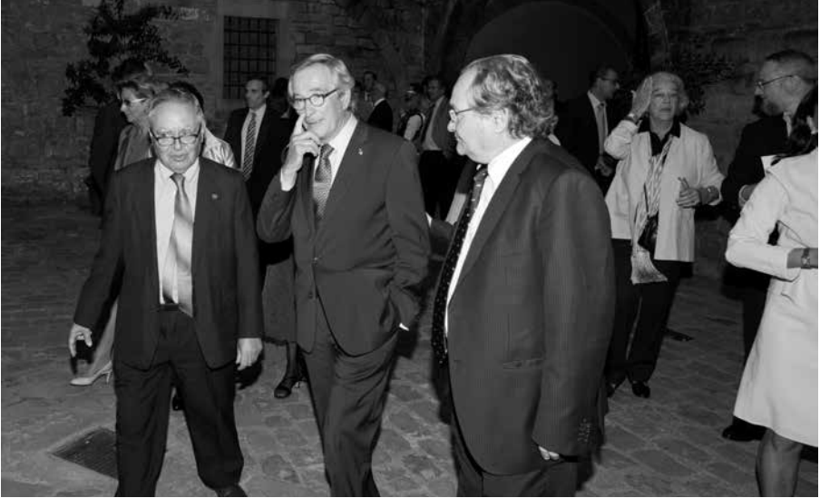
Acte d'homenatge a l'historiador Francesc Carreras i Candi amb motiu del 150è aniversari del seu naixement. Arribada a l'Acadèmia de l'alcalde Xavier Trias i Vidal de Llobatera.