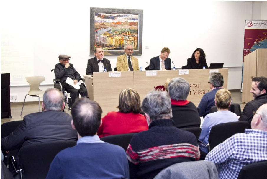
Acte de reconeixement de la URV, la UNED i la UOC el dia 3 de març del 2016, a Tortosa.