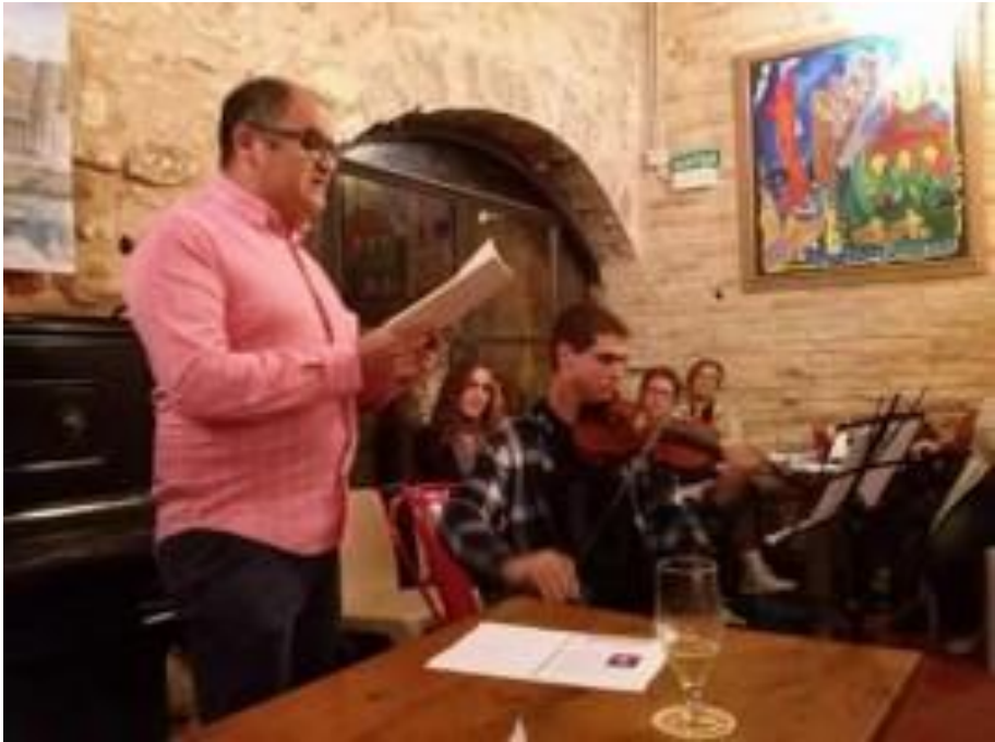
Homenatge poètic al Forn de la Canonja, de Tortosa, el 5 de novembre del 2015.