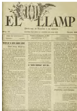
Portada d' El Llamp (30-11-1924).

Lo nostre article del Bolletí passat «A tots els amadors de la Llengua Catalana», com era un enfilall de veritats bofegants, se veu que no ha feta gayre gràcia an els... bofegats...¿Ha provat negú de demostrar que cap d'aquelles cosetes que enflocàrem an els nostres contraris de la Lliga Regionalista i de l' Institut d'Estudis Catalans , no siga vera? ... Un que's diu «admirador» de la nostra «Obra del Diccionari» etzibà dalt La Veu de Tarragona dia 26 de abril un articlàs calificant lo meu de «Prosa bàrbara», tractantme de «verinós» i tirantme altres floretes per l'estil, ane que me tenen acostumat aqueys caritativissims admiradors meus que ara me surten devers Catalunya, deixantse dir que, en lloch d'omplir lo meu Bolletinet de coses de Diccionari i de Llengua , l'umpl de «personalismes» i de glopades d'odi, i tot perque vim vi repello , perque defens la meua Obra i la meua còrpora dels taurons, tigres i lleoparts que fa sis anys palanquetgen per afonarnos dins un abisme d'imundicia. Aqueys catalanistes son així; ells me volen esclafar i passar an el dimoni l' Obra del Diccionari , i per conseguirho apellen a qualsevol atrocitat i atentat; i volen que jo m'estiga boca closa i sense bategar-me gota perque ells me puguen escorxar i desxuyar ab tota comoditat, i jo just badi la boca per dirlos: Grans mercès i que Deu les pagui la caritat!