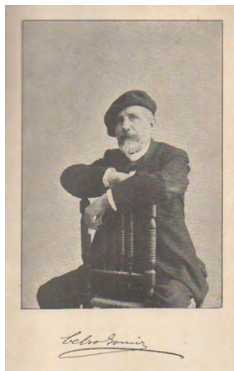
Fotografia de Cels Gomis publicada a Cantares . Barcelona: Luis Tasso, 1906.

L'objectiu d'aquest treball és oferir una panoràmica d'aquesta relació entre el folklorista i la Ribera d'Ebre, a partir de les seves vivències personals i del material recollit personalment per ell i publicat en diferents revistes. Això permetrà resseguir la petjada del folklorista i, alhora, recuperar algunes de les mostres folklòriques que va deixar en la seva obra i que es localitzen en aquesta zona.