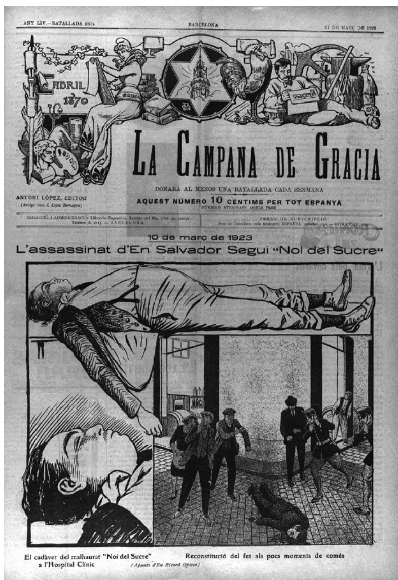
Dibuix de Ricard Opisso a La Campana de Gracia , del 17 de març de 1923, en que reconstrueix l'assassinat de Salvador Seguí.

cidir-ne l'adhesió provisional a la Tercera Internacional, va posposar qualsevol projecte d'unió amb la UGT i va proclamar el comunisme llibertari com a meta de la CNT. També va estar present a la Conferència Nacional, clandestina, de la CNT, celebrada a Saragossa el juny del 1922 —quan es va retirar l'adhesió de la CNT a la Tercera Internacional i a l'AIT, mentre es reafirmava en l'apoliticisme tradicional—, així com en els continus, i amagats, intents de conciliació entre sindicats únics i Sindicats Lliures a finals d'aquell any.