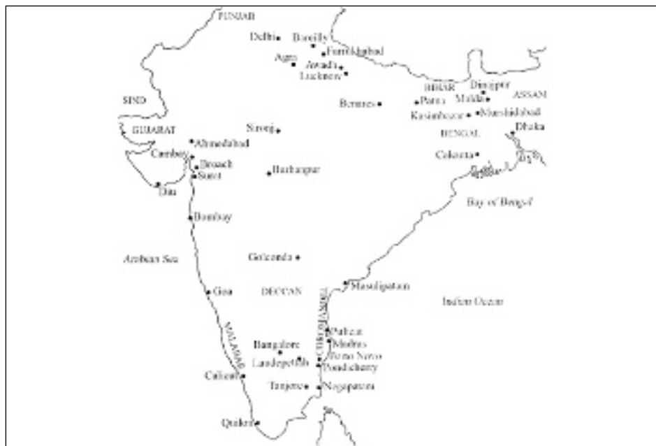
Figura 2. Principals centres tèxtils de l'Índia, segles XVII-XVIII (segons Parthasarathi, 2009).