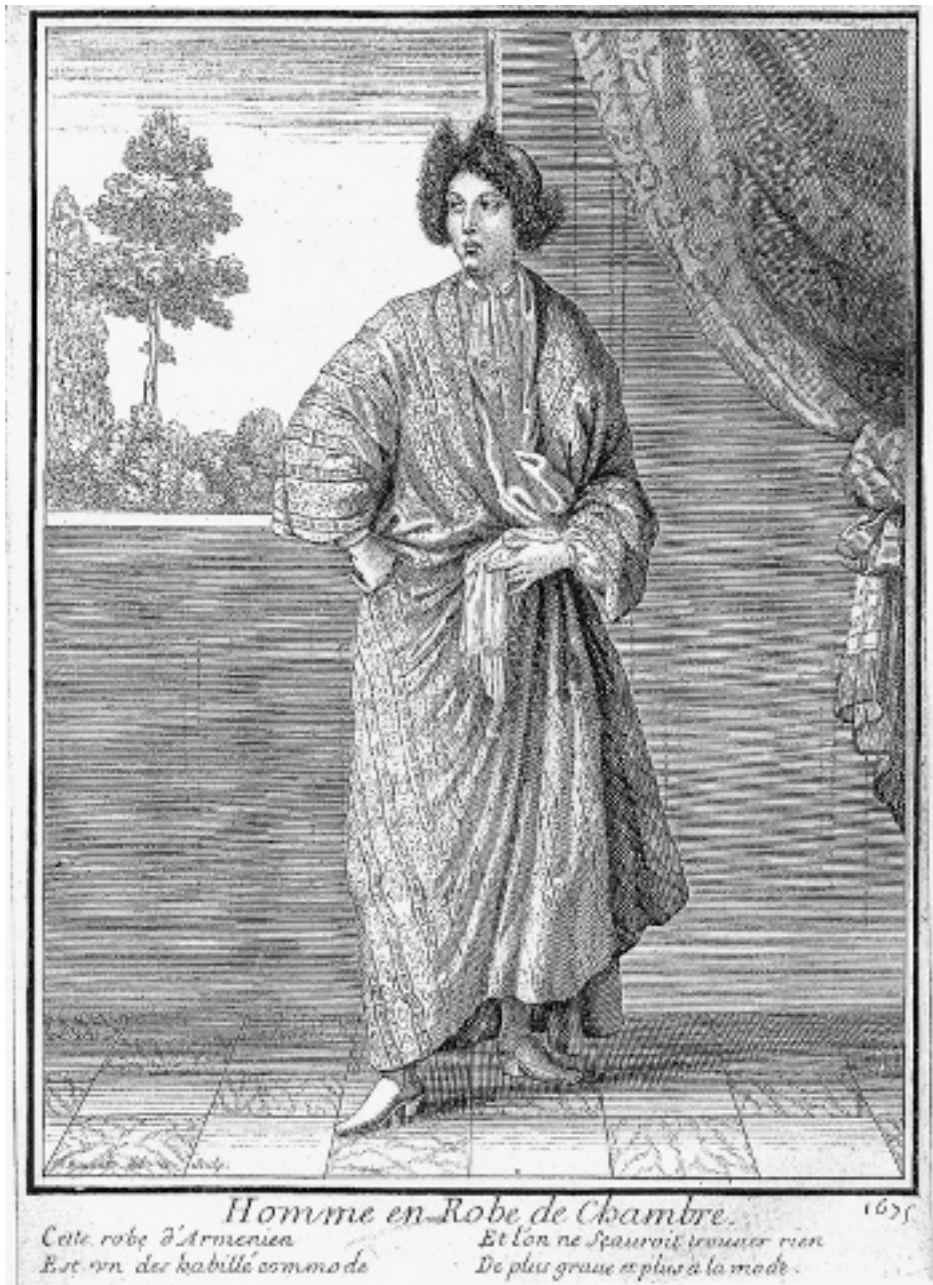
Figura 4. : Bata o "robe d'arménien" (N. BONNART, Recueil des modes à la cour de France , Paris, 1675).