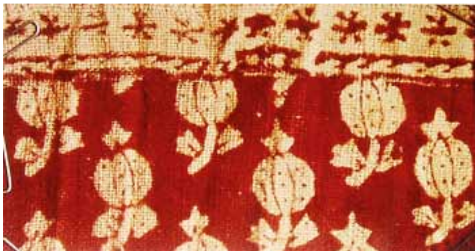
Figura 1. Mostra d'un xafargani importat a Marsella, vers 1770 (ADBdR, Archives départementales des Bouches-du-Rhône, C 3374).

Consumida a escala planetària des del final del segle XVII, la indiana és el primer producte manufacturat dels inicis de la mundialització. A partir de la dècada de 1650 el comerç d'aquestes cotonades fabricades a l'Àsia agafa empenta al vell continent. Com que aporta els avantatges d'una fibra tèxtil poc utilitzada fins llavors i ofereix nous repertoris de decoració, la indiana acaba transformant la cultura material europea i esdevé, al segle XVIII, la principal palanca d'arrencada de la primera revolució industrial. 1 L'Europa mediterrània va participar plenament en aquesta història. Teixits com els xafargani i els mezzari , a més, recorden amb força l'apropiació d'aquestes teles asiàtiques per part dels provençals i els lígurs, que en van fer elements emblemàtics de la seva vestimenta i de la seva indústria fins al segle XIX (Figura 1).