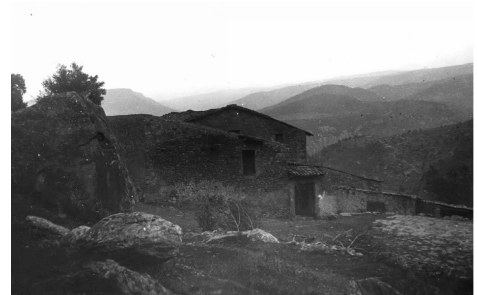
Fig. 2. El mas Valldaneu l'any 1932. (AFCEC EMC_X_3502)