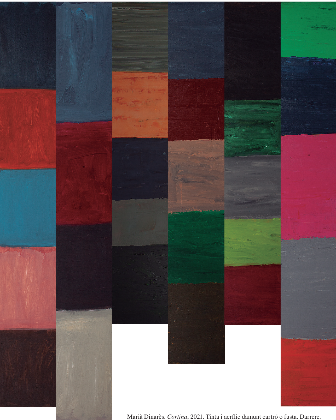
Marià Dinarès. Cortina , 2021. Tinta i acrílic damunt cartró o fusta. Darrere.