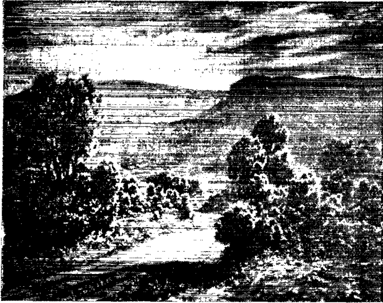
Segismundo Clavería — Paisaje.