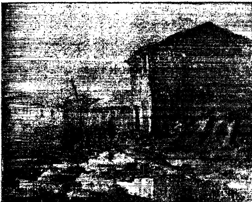
Miguel Cerrada -- Paisaje.

A la vista de lo realizado podrá juzgarse la enorme actividad artística que en la temporada finida ha llevado al palenque local, nacional e internacional, la ciudad de Vich.— J. S.