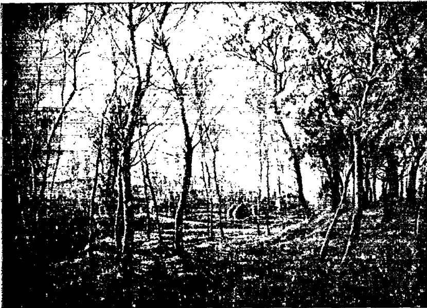
Jacinto Conill — Álamos y robles. Tercera medalla en la Exposición nacional de Bellas Artes de 1950. Museo de Arte Moderno de Madrid