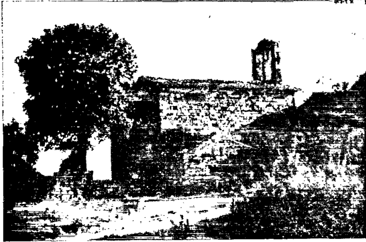
Conjunt de la capella actual amb l'absis primitiu conservat al costat.

al mateix segle, que fa pensar en el portal primitiu transplantat a l'església del segle XII o almenys una còpia. Aquests fragments junt amb les esglésies de Santa Maria de Matadars al Pont de Vilomara, Sant Pere de Brunet a Guardiola i les deixalles conservades a Rellinàs, Castellbell, Sant Mateu i Sant Benet de Bages, són les úniques despulles identificades que s'han conservat al Pla de Bages de tan llunyanes èpoques.