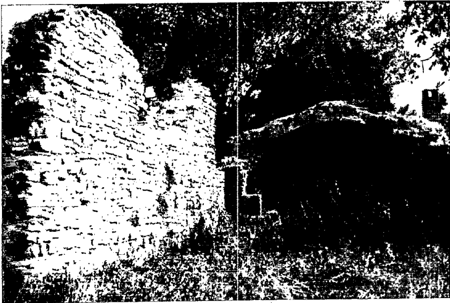
Interior de l'església i mur de tramuntana