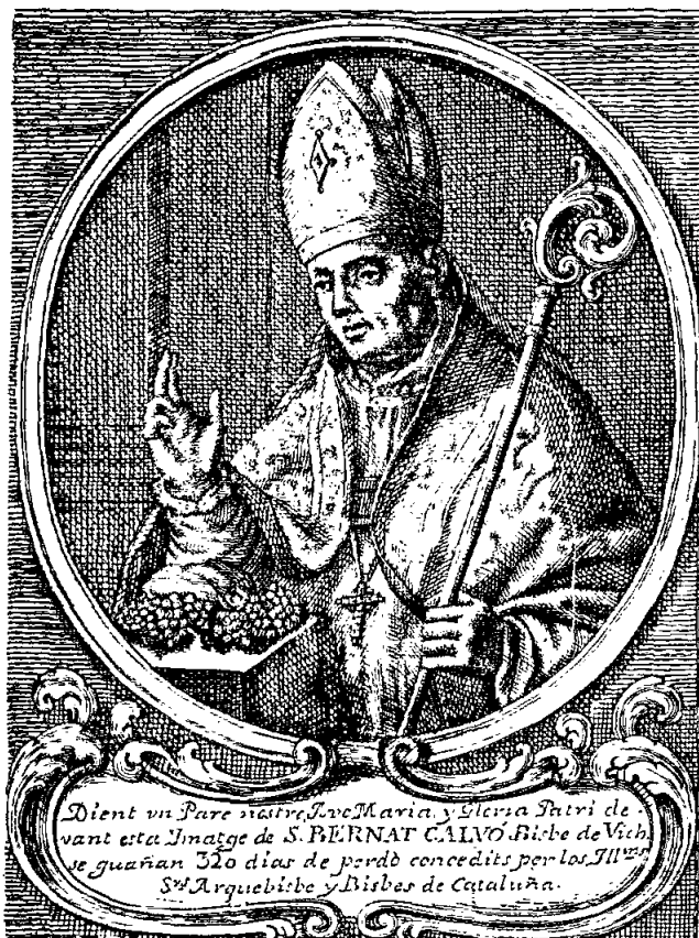
Gravat del segle XVIII amb l'efigie del sant.