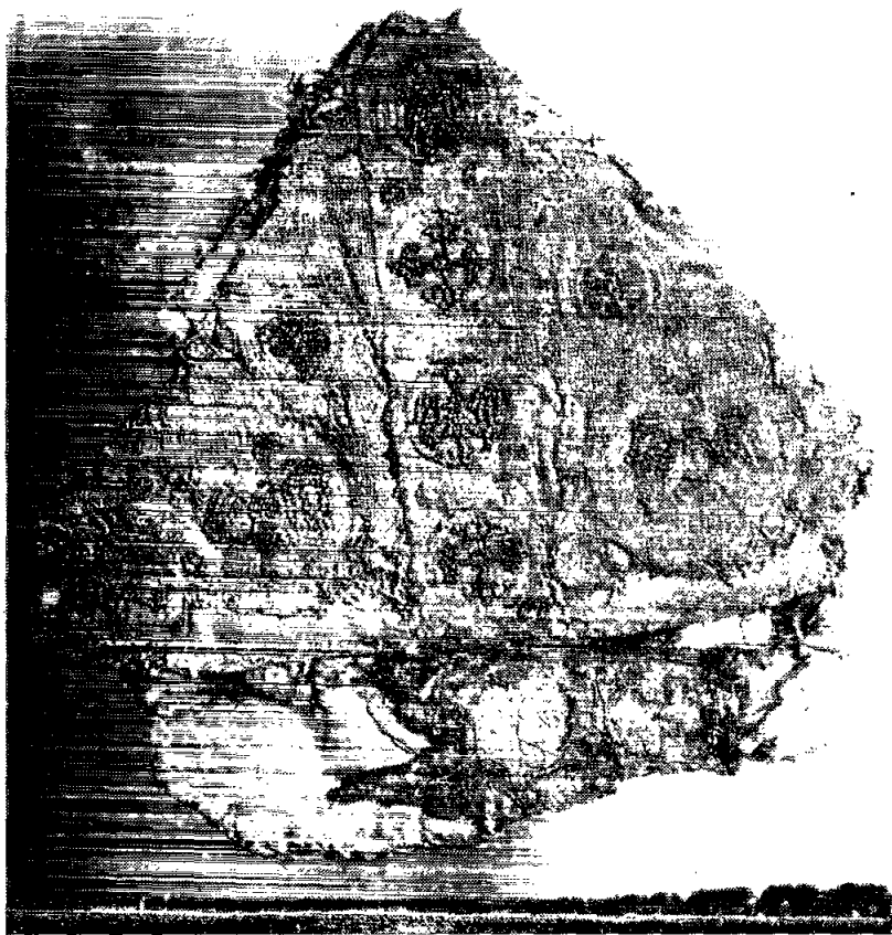
Mitra «preciosa» de sant Bernat.