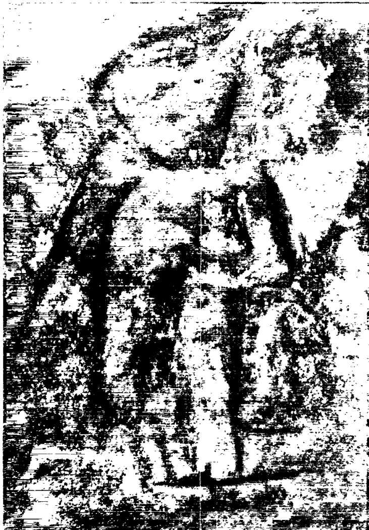
Fotografia 1: Figura antropomorfa («Pedra 1»)