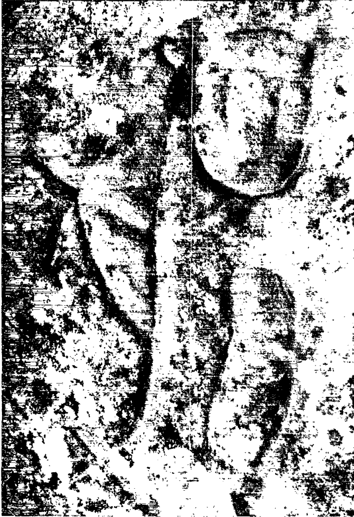
Fotografia 3: Combinació d'elements («Pedra 2» - «Pedra de les bruixes»)