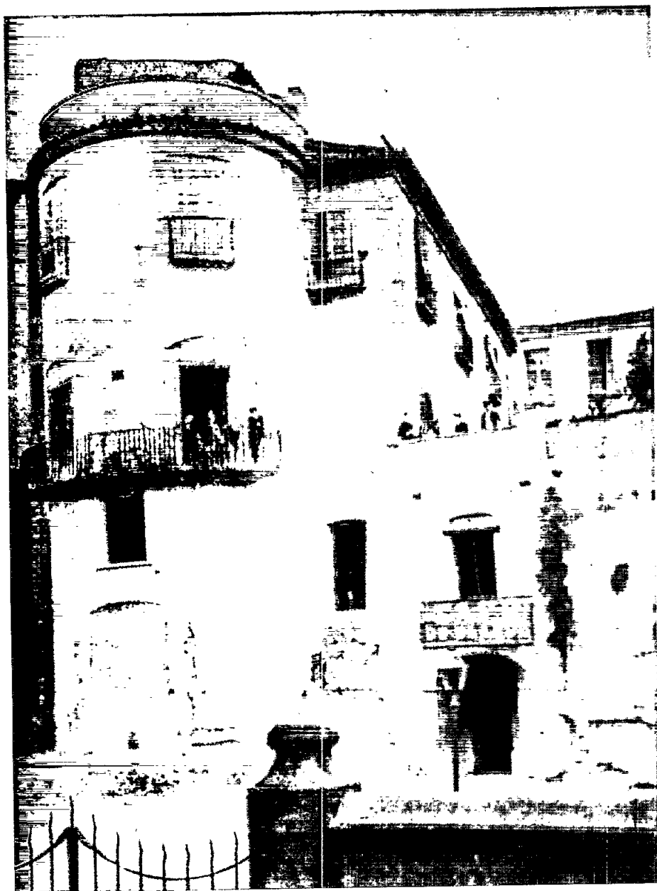
La torre de can Rol, davant l'església de les Davallades, desapareguda en construir-se Casa Comella.