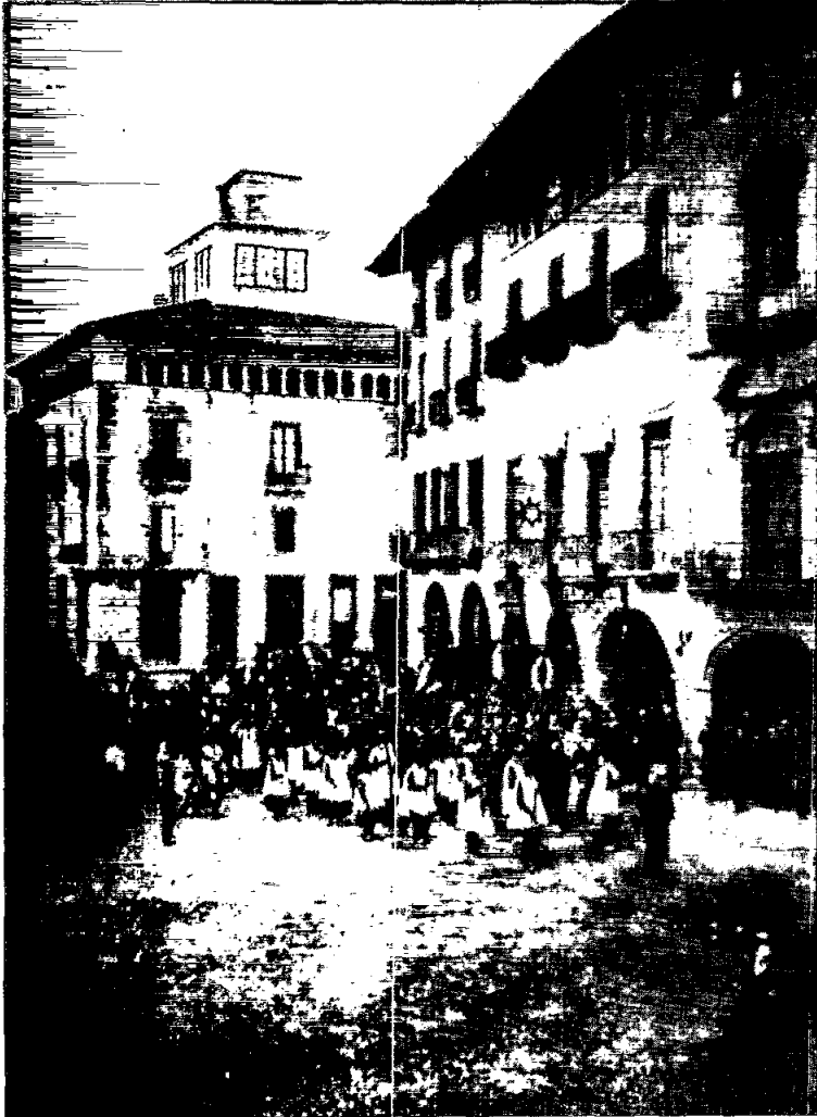
Un angle de la plaça de Vic a finals del segle XIX, amb Can Roí al fons

higiènics, de netedat, d'aliments, on afloren màximes de l'Eclesiàstic, de Plutarc, d'Aristòtil, de Fenelon, de Sant Joan Crisòstom, de Quintilià, i aforismes de l'escola de Salern: «Pone guale metas ut sit tibi longa vetas» (Posa traves a la gola perquè ta vida sigui llarga), «Ésser sobri no és una gran virtut, però és un gran defecte no ser-