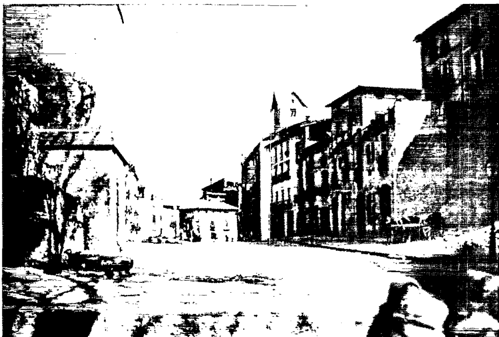
La rambla de les Davallades abans de l'obertura del carrer de Verdaguer.

del clos de la muralla, havien demanat, amb la construcció del pont de la carretera de Barcelona i el pas d'aquesta rambla amunt, una elevació del terreny creant davant les cases uns desnivells que molts encara hem conegut (1862). Les rambles de l'Hospital i Davallades, abans d'obrir el carrer d'en Verdaguer (1910) oferien una solució de continuïtat i si ens aturem sols a la part esquerra, podriem assegurar que des de l'edifici actual de Correus fins al carrer de Gurb potser sols trobaríem un edifici de l'època. La comitiva es parà un moment en l'església del Carme, parròquia des de feia poc (1877) i es dirigí pel carrer de Gurb, a través dels terrenys mig urbanitzats d l'horta d'en Xandri, cap al cementiri nou.