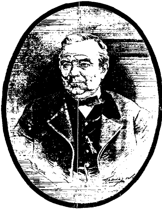
Joaquim Salarich i Verdaguer. Dibuix a la ploma de P. Ross. Publicat a «La Il·lustració Catalana» el 15 d'Abril de 1884