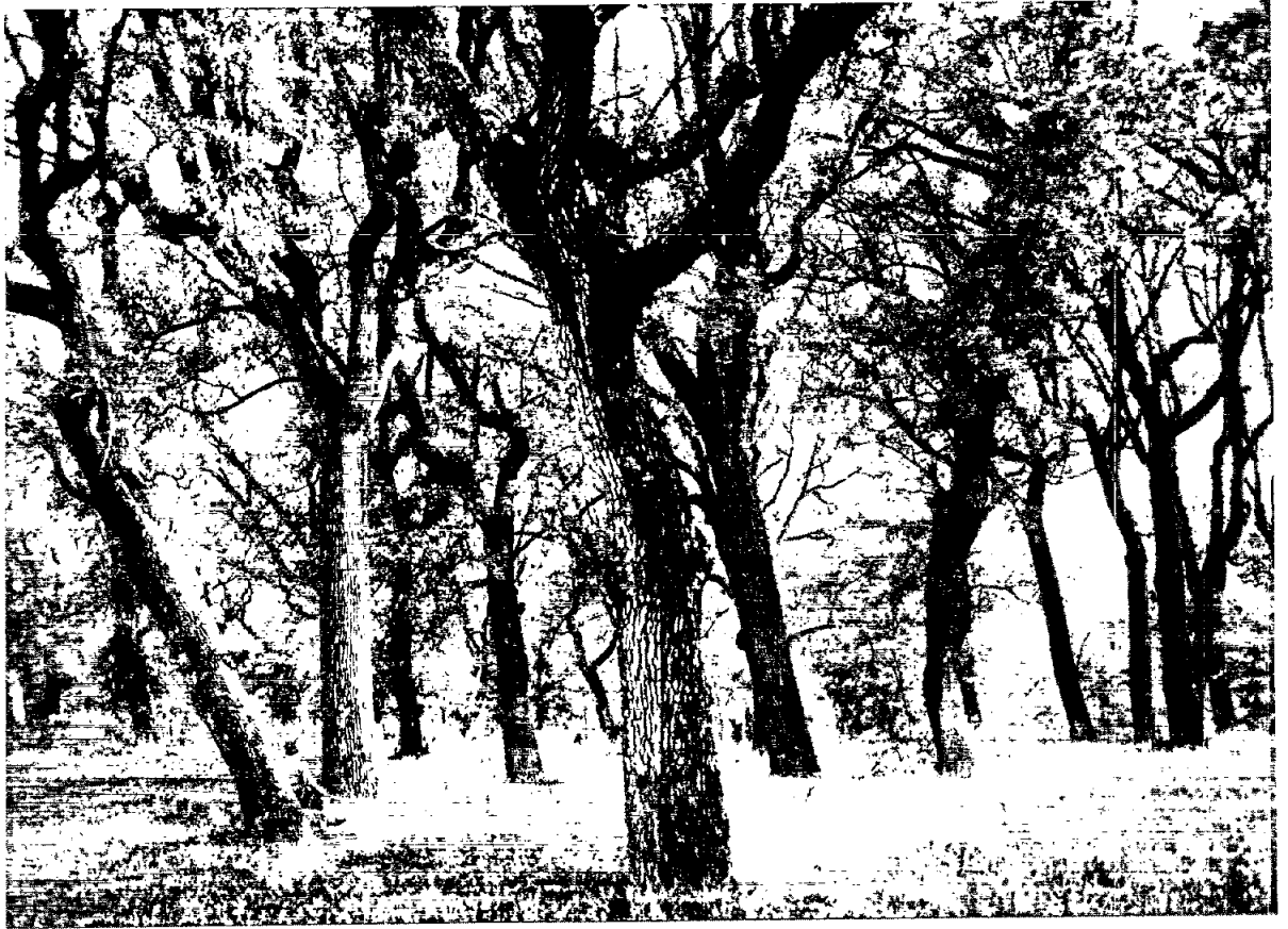
Roureda del Cantarell, municipi de Vic.