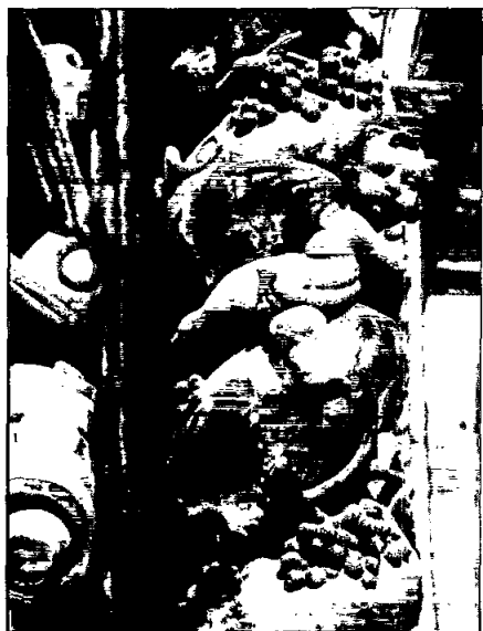
Detall de la columna esquerra de la fornícula del carrer esquerre del cos principal del retaule de Sant Isidre, de l'església parroquial de Sant Julià de Vilatorça.