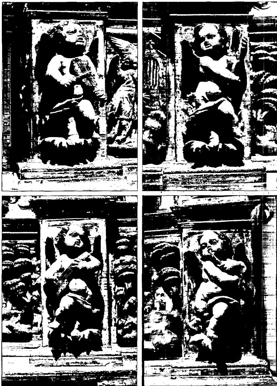
Àngels músics de la predel·la del retaule de Sant Isidre, de l'església parroquial de Sant Julià de Vilatorrada.