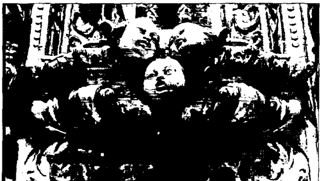
Ménsula de la fornícula principal del retaule de Sant Isidre, de l'església parroquial de Sant Julià de Vilatorça.