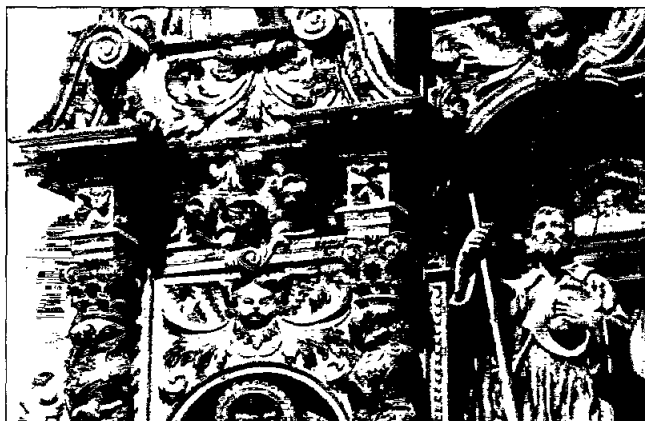
Detall del carrer esquerre del retaule de Sant Isidre, de l'església parroquial de Sant Julià de Vilatorça.